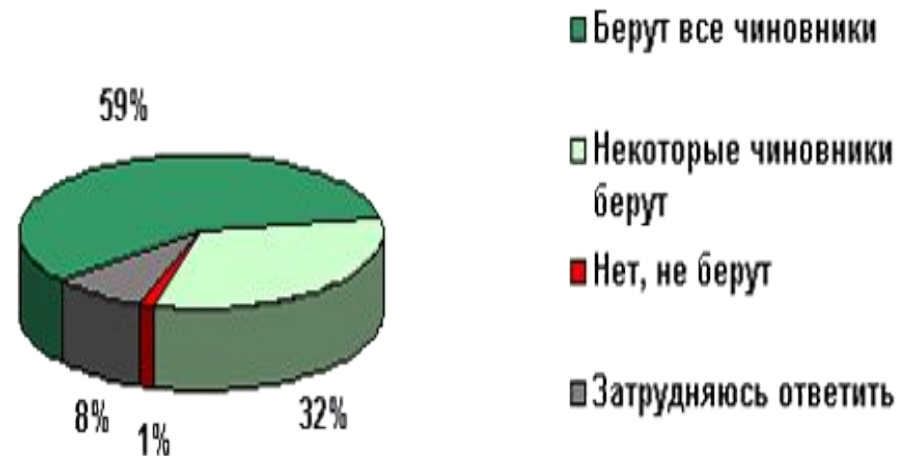
Диаграмма 1. Как вы думаете, берут ли чиновники взятки?