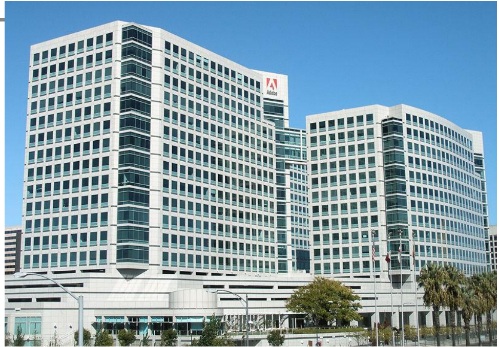
Штаб-квартира Adobe Systems в Сан Хосе

■ Adobe Systems, Inc. — компания-разработчик программного обеспечения, основана в декабре 1982 г. Джоном Уорноком и Чарльзом Гешке. Они основали Adobe после того как покинули Xerox PARC с тем, чтобы продолжить разработку PostScript и извлекать из этого коммерческую прибыль.