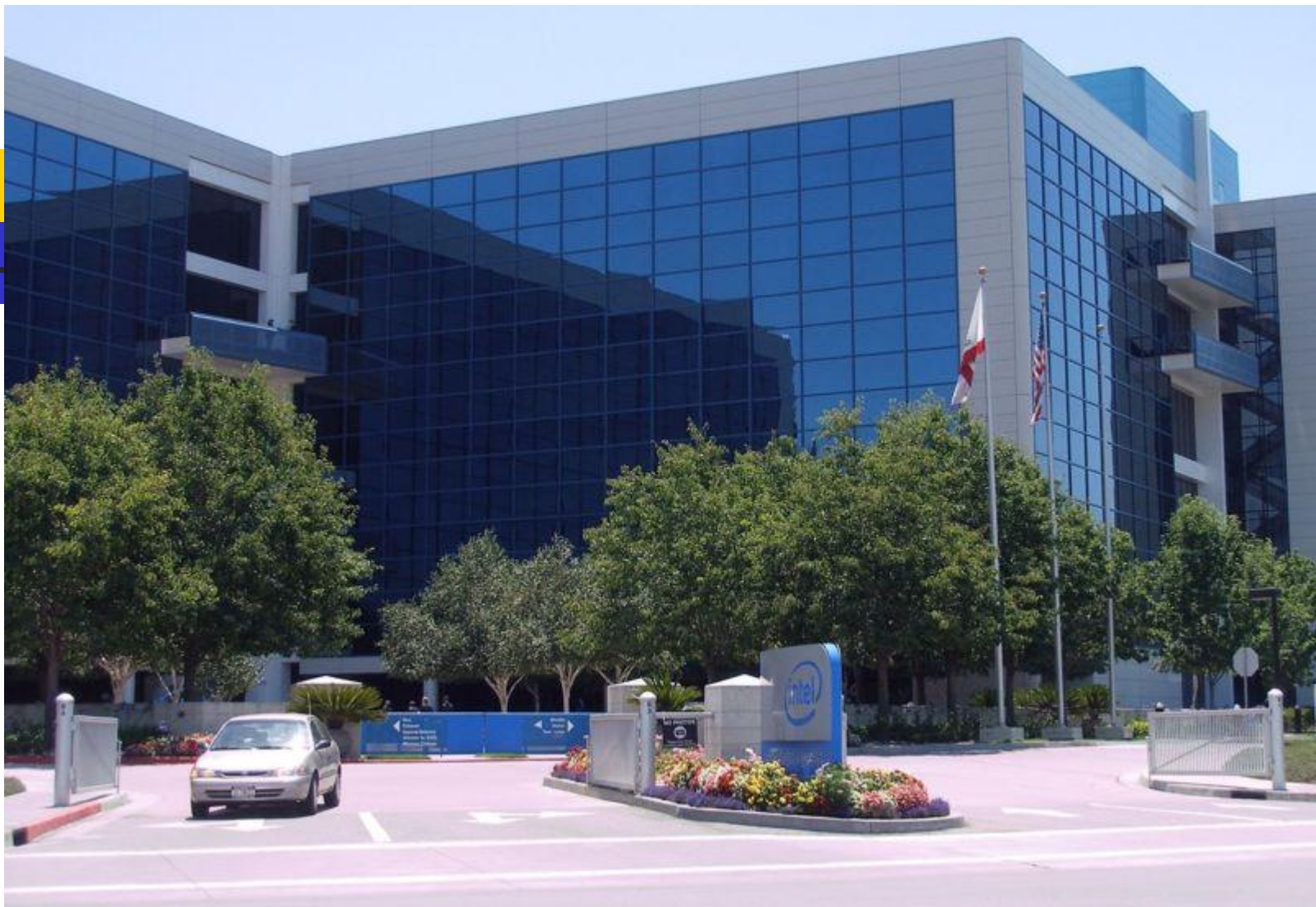
Офис компании Intel