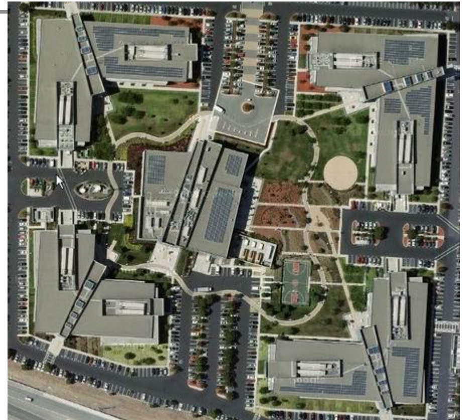
Офис компании Microsoft в Силиконовой долине