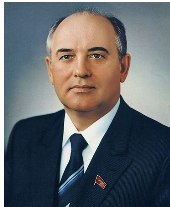
Михаил Сергеевич Горбачев