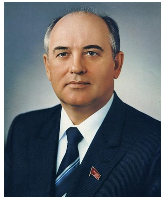
Михаил Сергеевич Горбачев