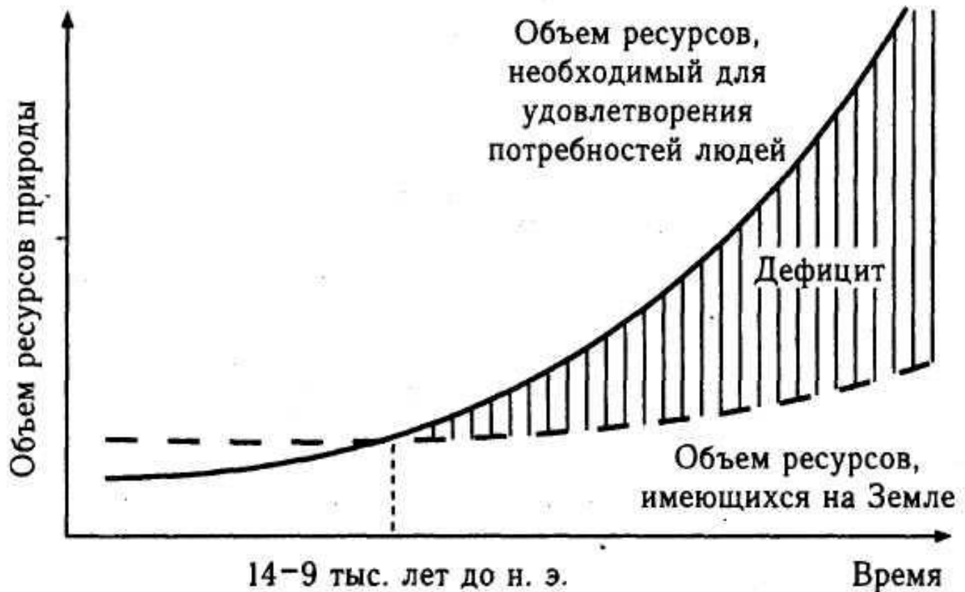
Рис. 1.1. Ограниченность ресурсов