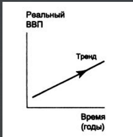
ч/з кривую реального ВВП