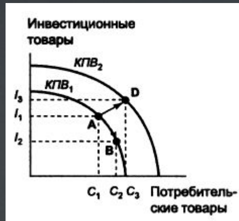
ч/з кривую производственных возможностей