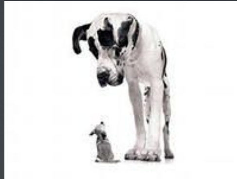
УМЕНЬШАЮЩАЯСЯ ОТДАЧА ОТ КАПИТАЛА