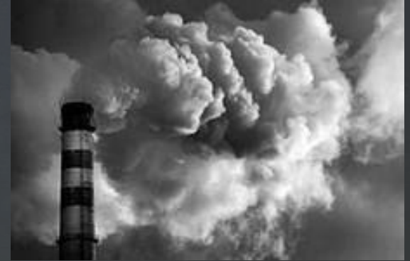
ЗАГРЯЗНЕНИЕ ОКРУЖАЮЩЕЙ СРЕДЫ