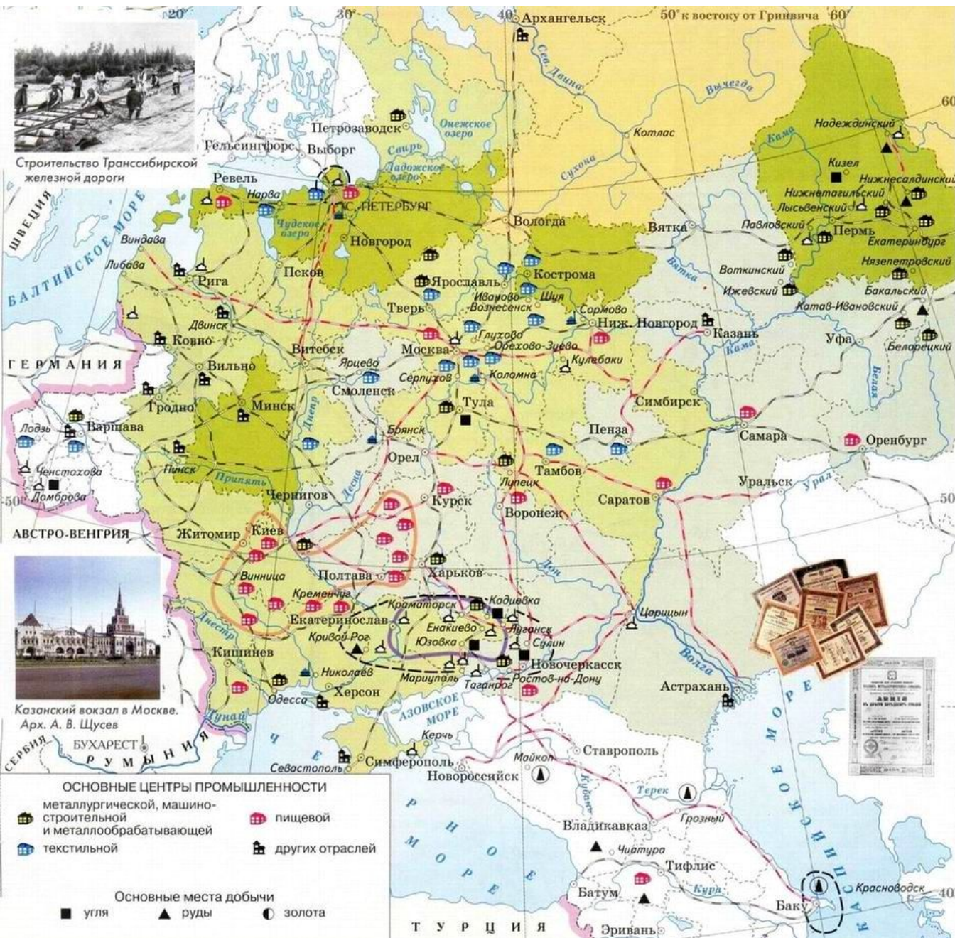
Строительство Транссибирской железной дороги