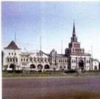
Казанский вокзал в Москве. Арх. А. В. Шусев