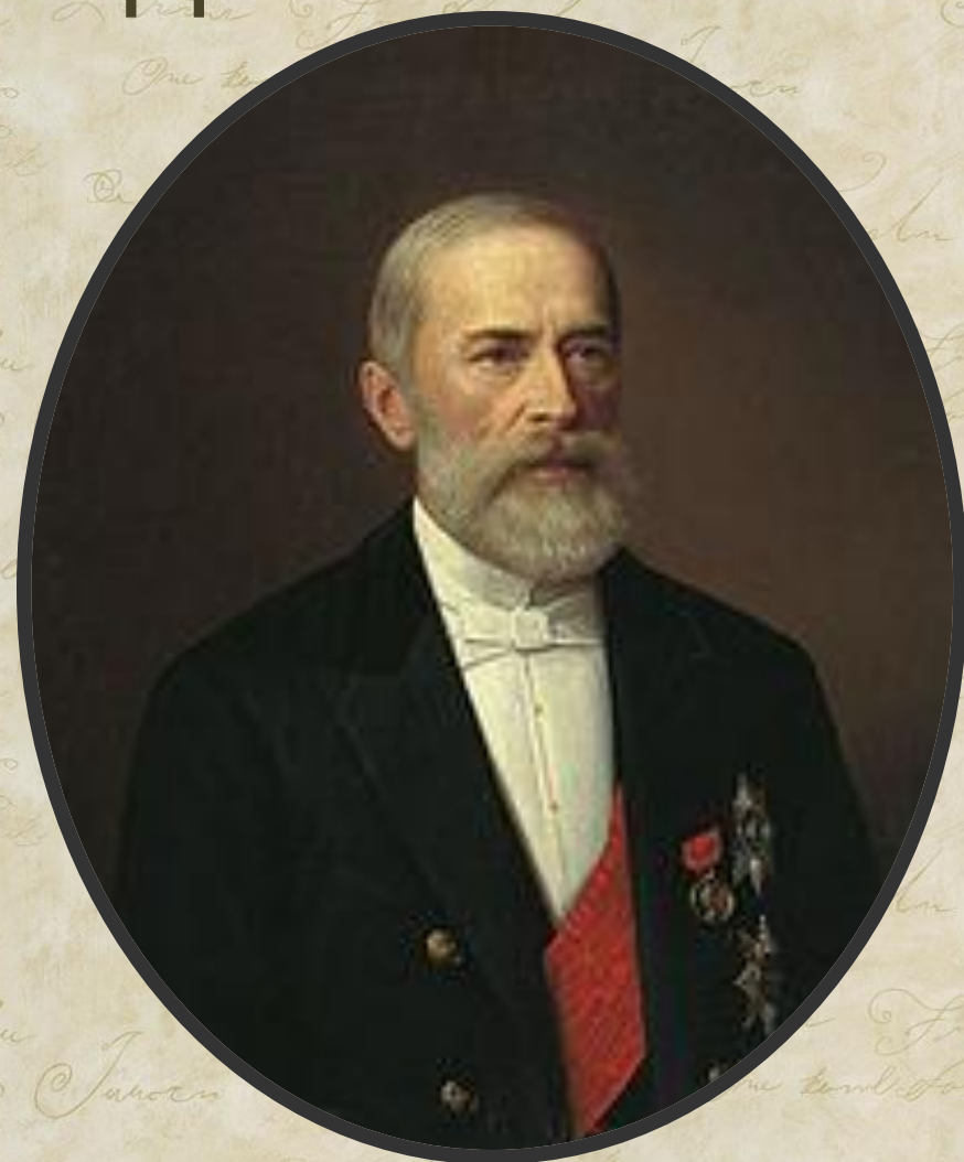
Николай Христианович Бунге