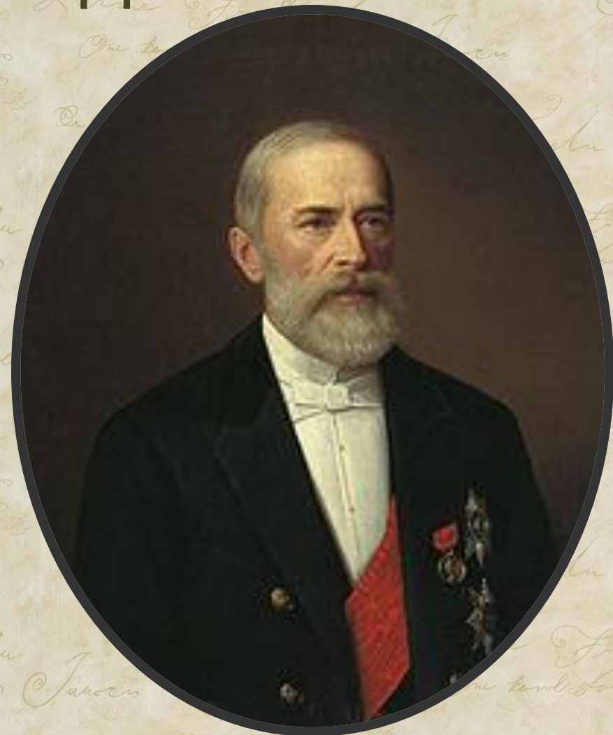
Николай Христианович Бунге