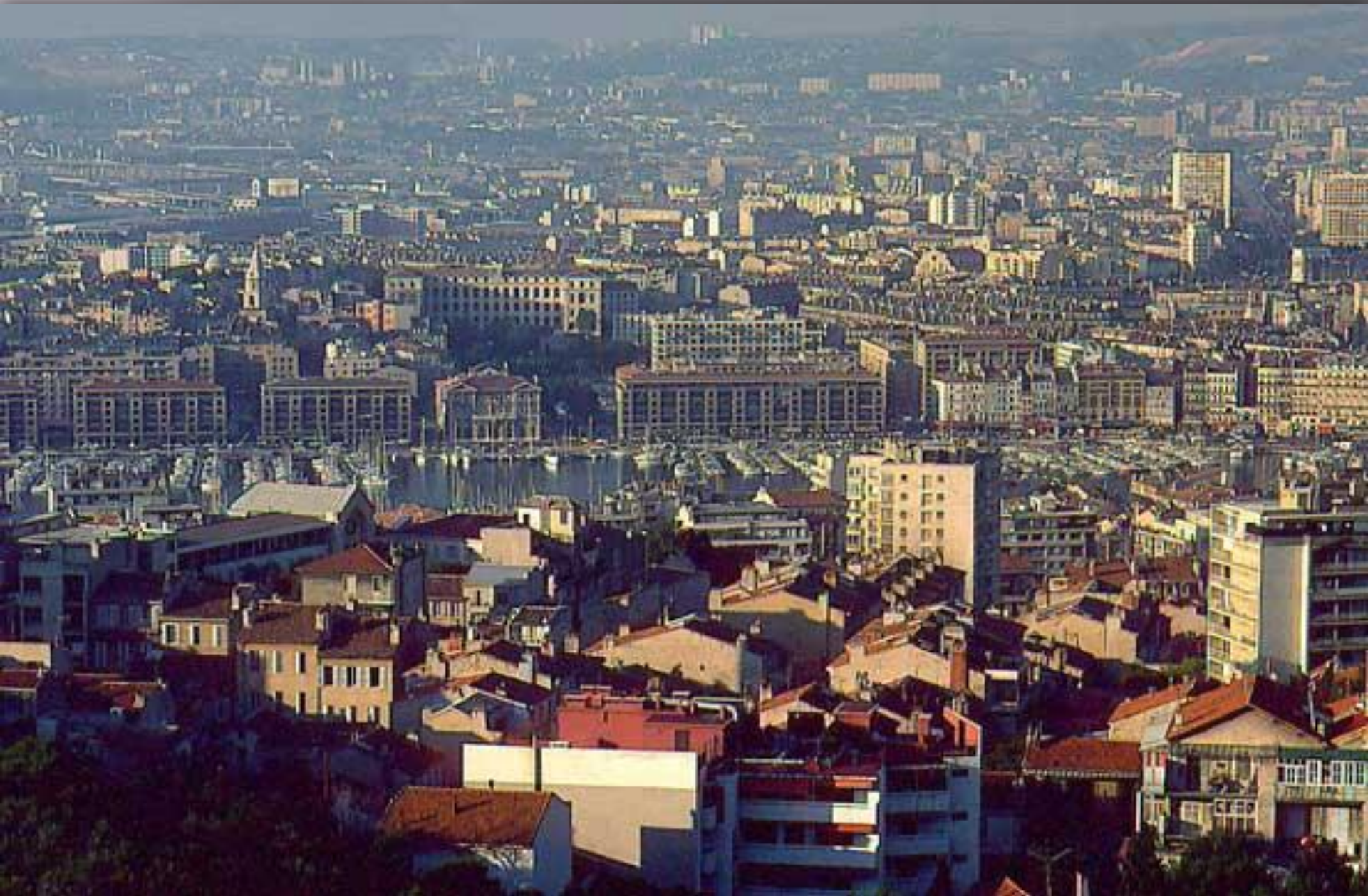
МАРСЕЛЬ, крупный портовый город на средиземноморском побережье Франции