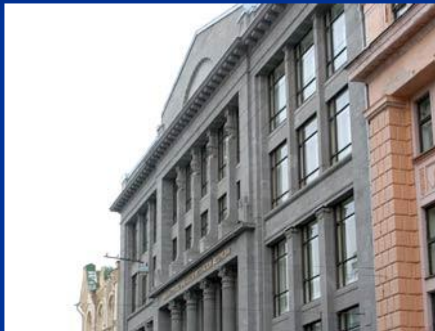
Министерство финансов России, Москва