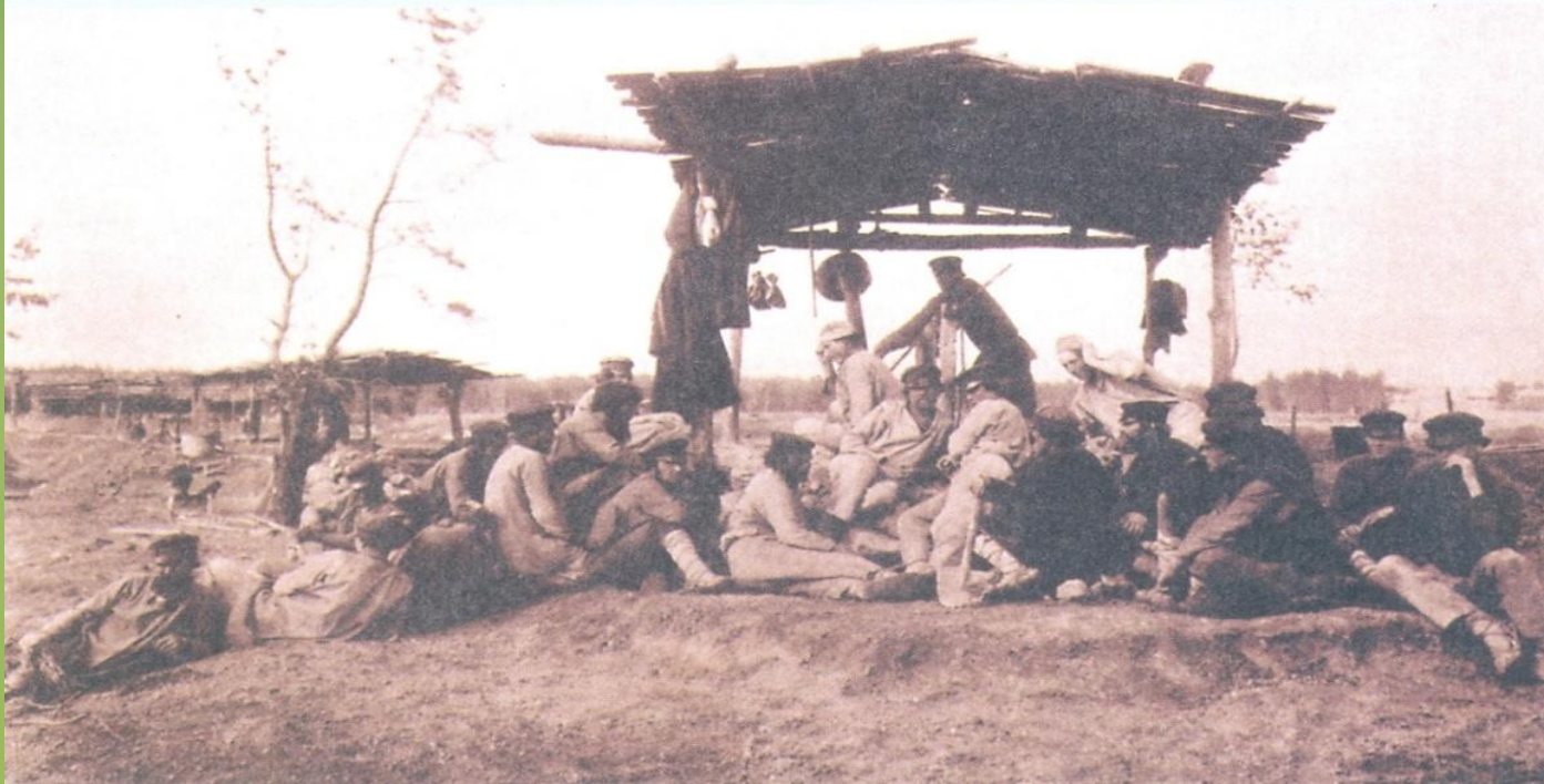
Рудокопы возле рудника-«дудки». Фотография XIX в.