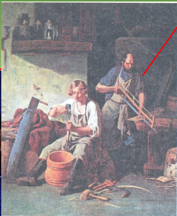
В бондарной. Художник А. Плахов. Бондарный промысел – изготовление деревянных бочек