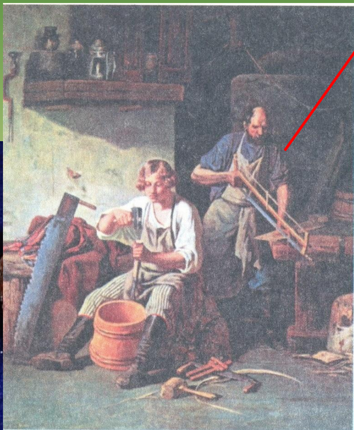
В бондарной. Художник А. Плахов. Бондарный промысел – изготовление деревянных бочек