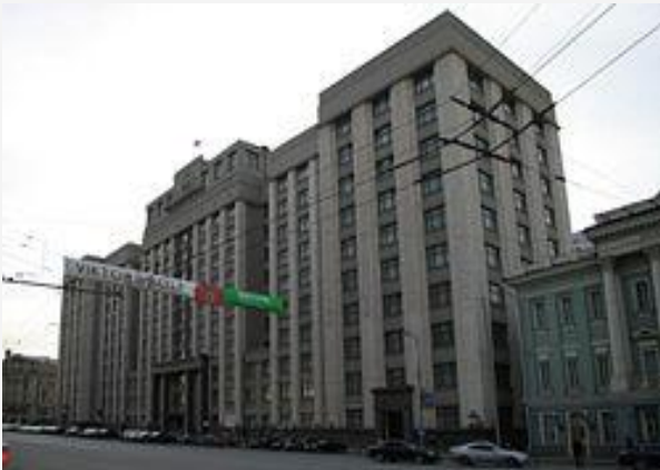
Здание Государственной думы