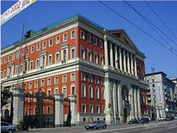
Здание Московской мэрии