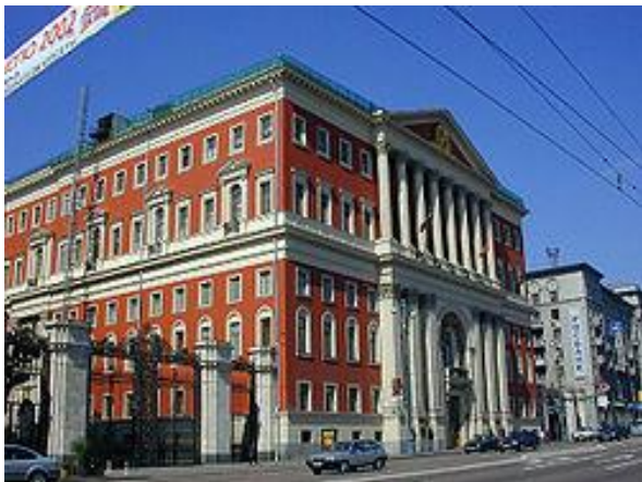
Здание Московской мэрии