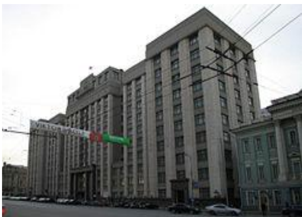
Здание Государственной думы