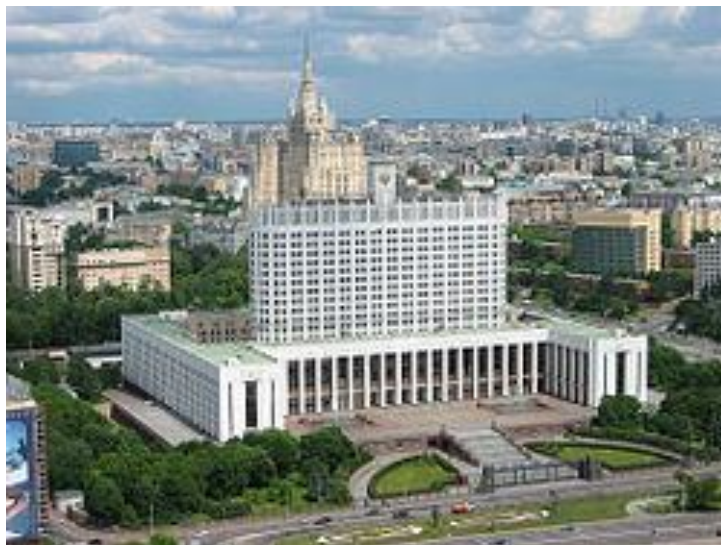
Дом Правительства России