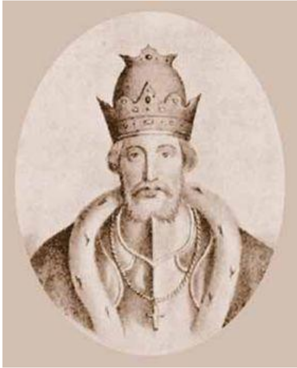
Князь Юрий III Данилович