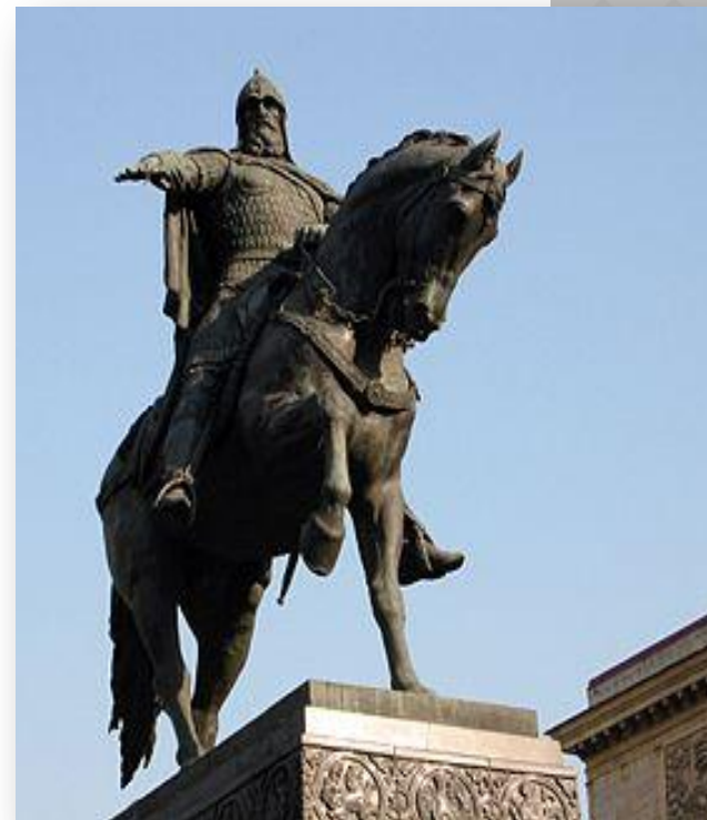
Памятник основателю Москвы Юрию Долгорукому