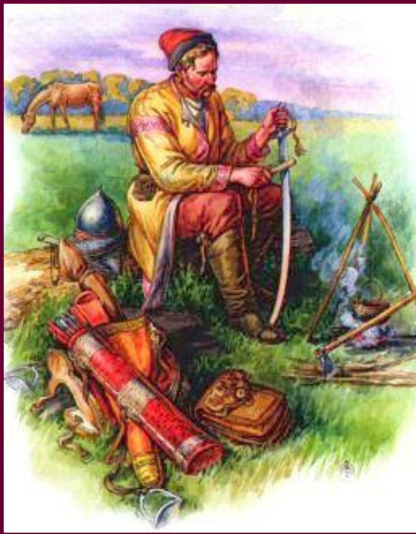
Казак на отдыхе.