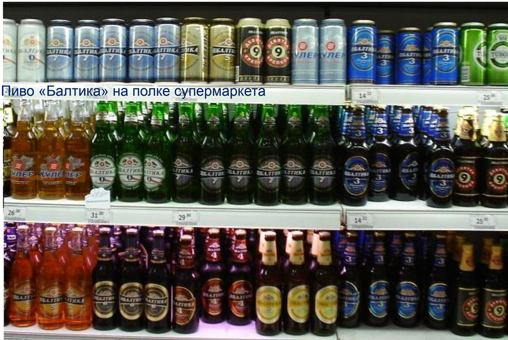
Пиво «Балтика» на полке супермаркета