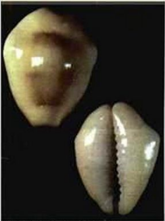
Раковины каури- первая мировая валюта

Закрепление за золотом роли всеобщего эквивалента