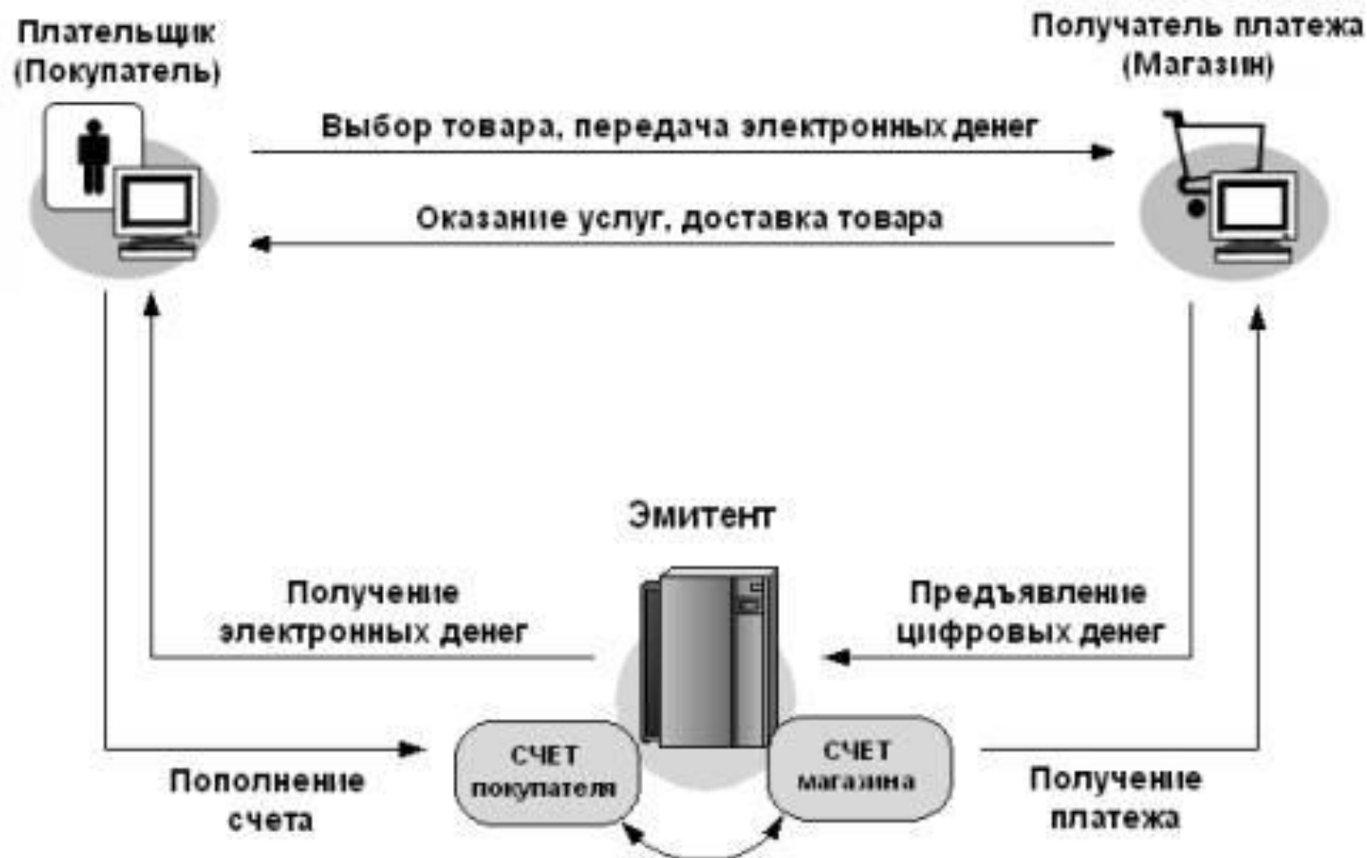
СХЕМА ПЛАТЕЖЕЙ С ПОМОЩЬЮ ЭЛЕКТРОННЫХ ДЕНЕГ