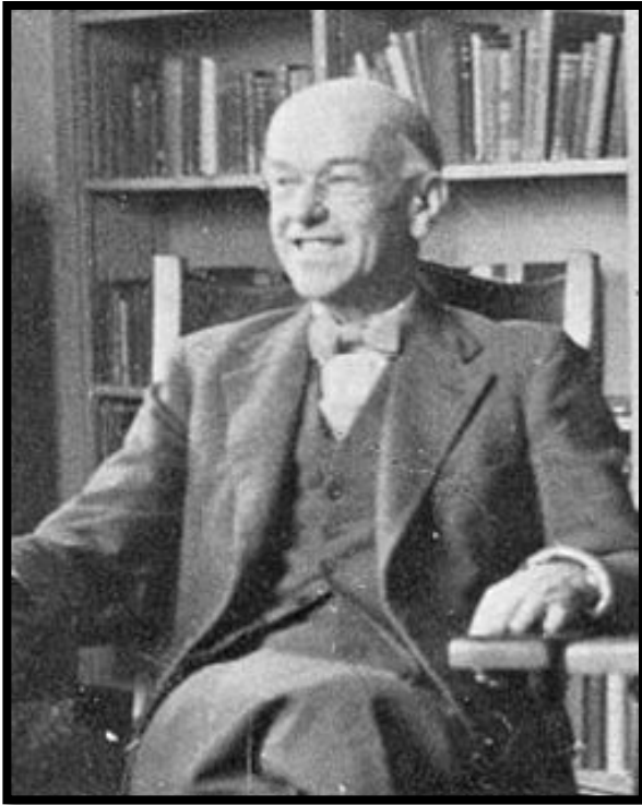
Джордж Элтон Мэйо (1880—1949)

Профессор Гарвардского университета Э.Мэйо выдвинул теорию «человеческих отношений» в управлении.