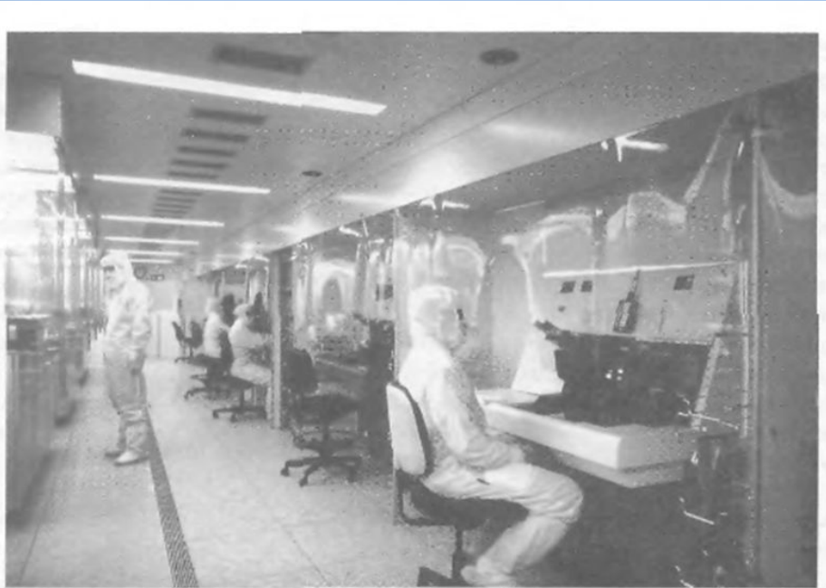
Рис. 7.4. Производственные участки, спроектированные по принципу чистых туннелей