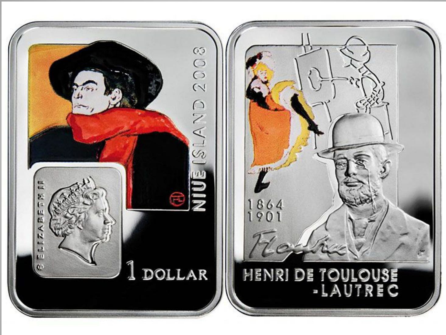
Ниуэ 1 доллар