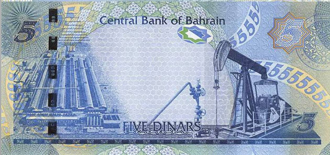
Бахрейн 5 динар