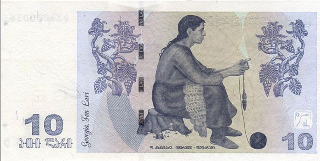
Грузия 10 лари