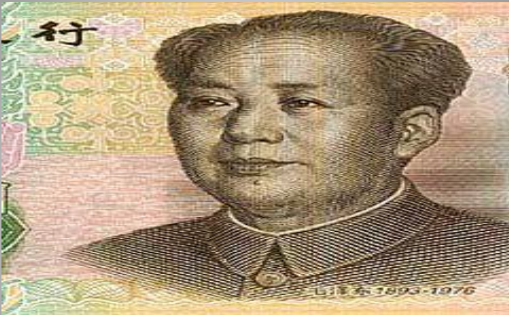
Китайский юань с Мао Цзэдуном.