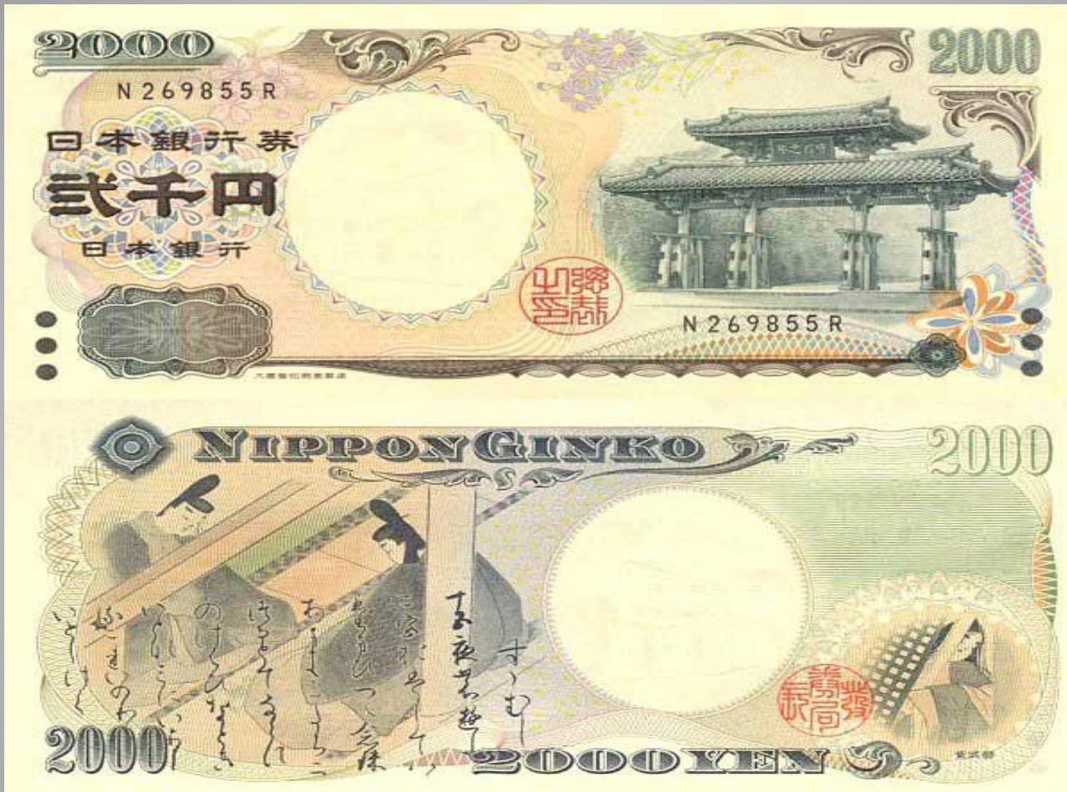
Япония 2000 иен