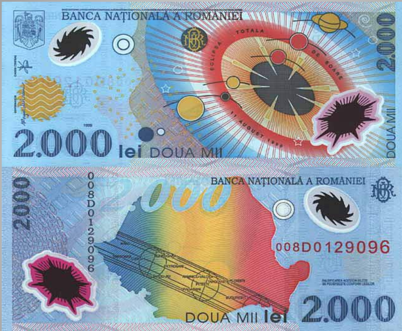
Румыния 2000 лев