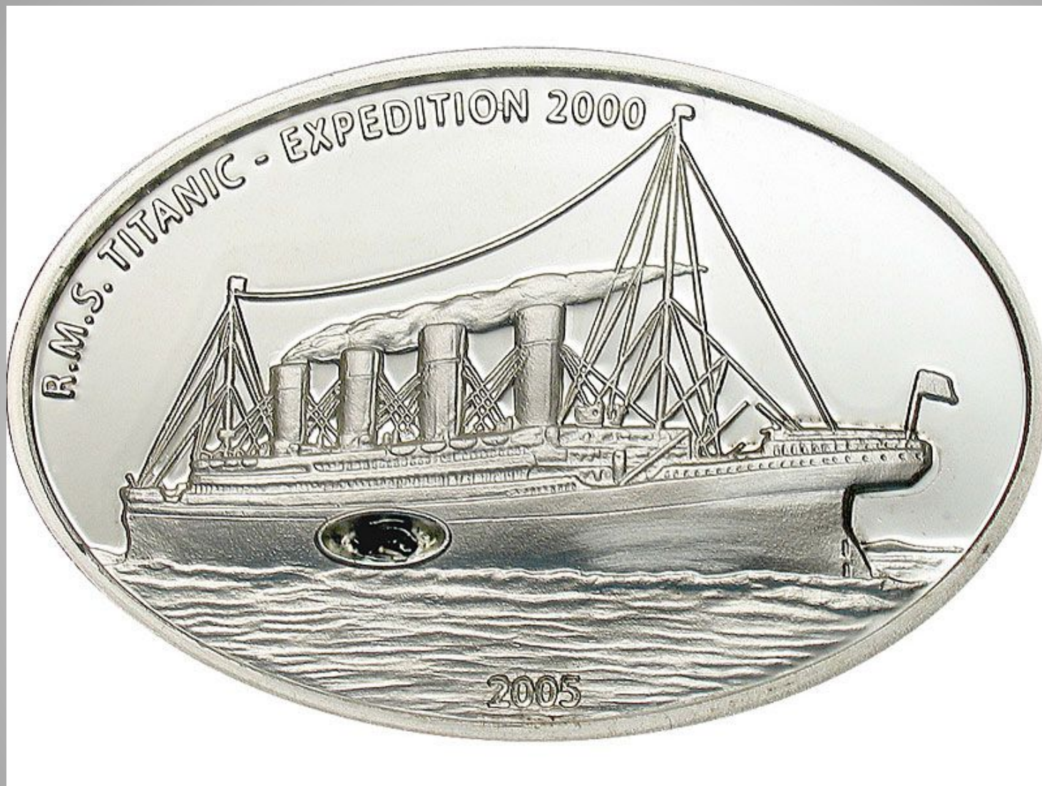
Либерия 10 долларов