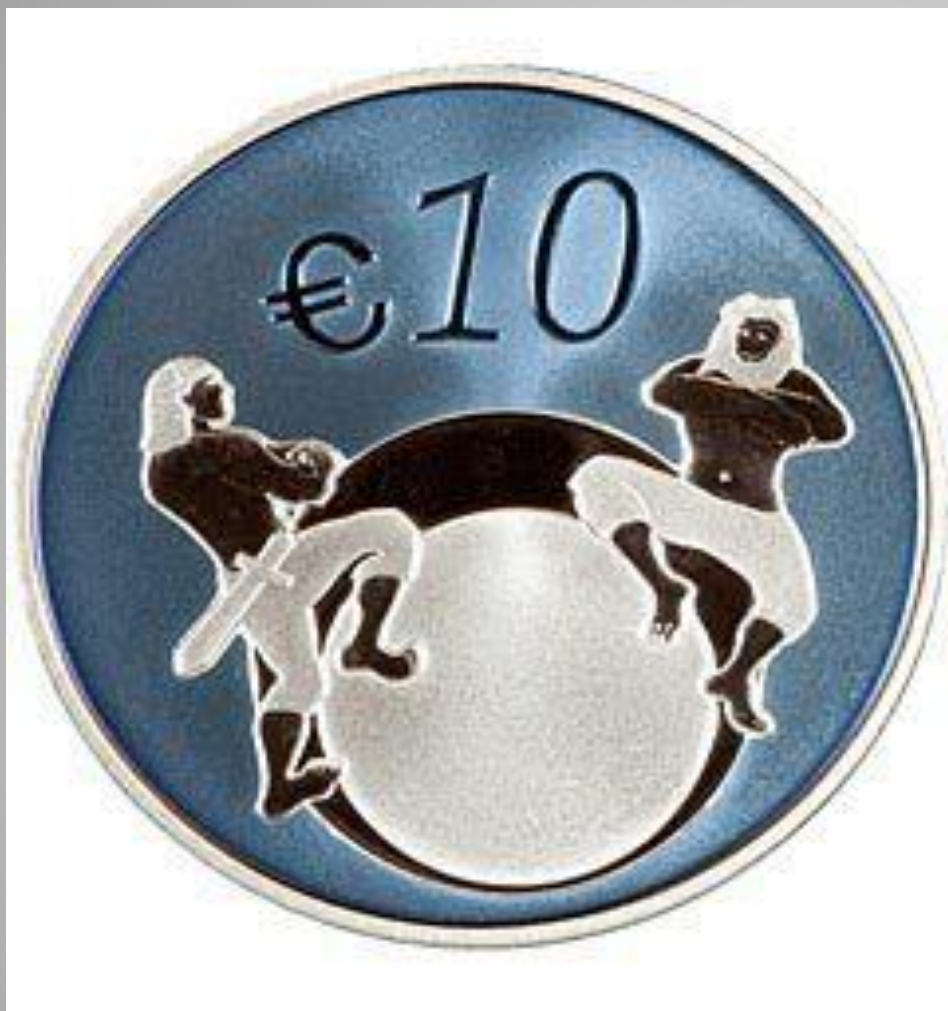
Коллекционная серебряная монета 10 евро Банка Эстонии