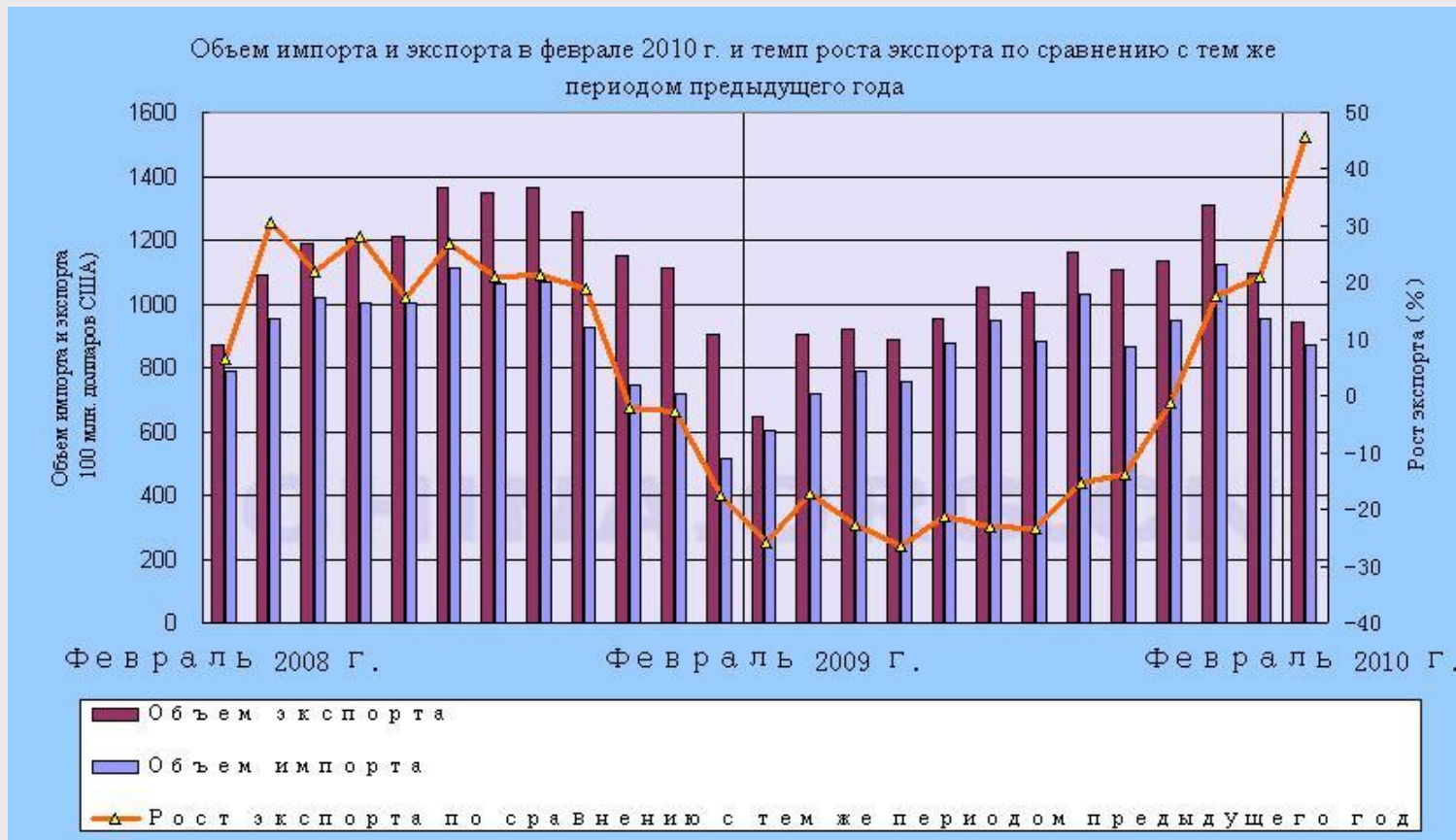
Рис. №1 Объем экспорта и импорта Китая