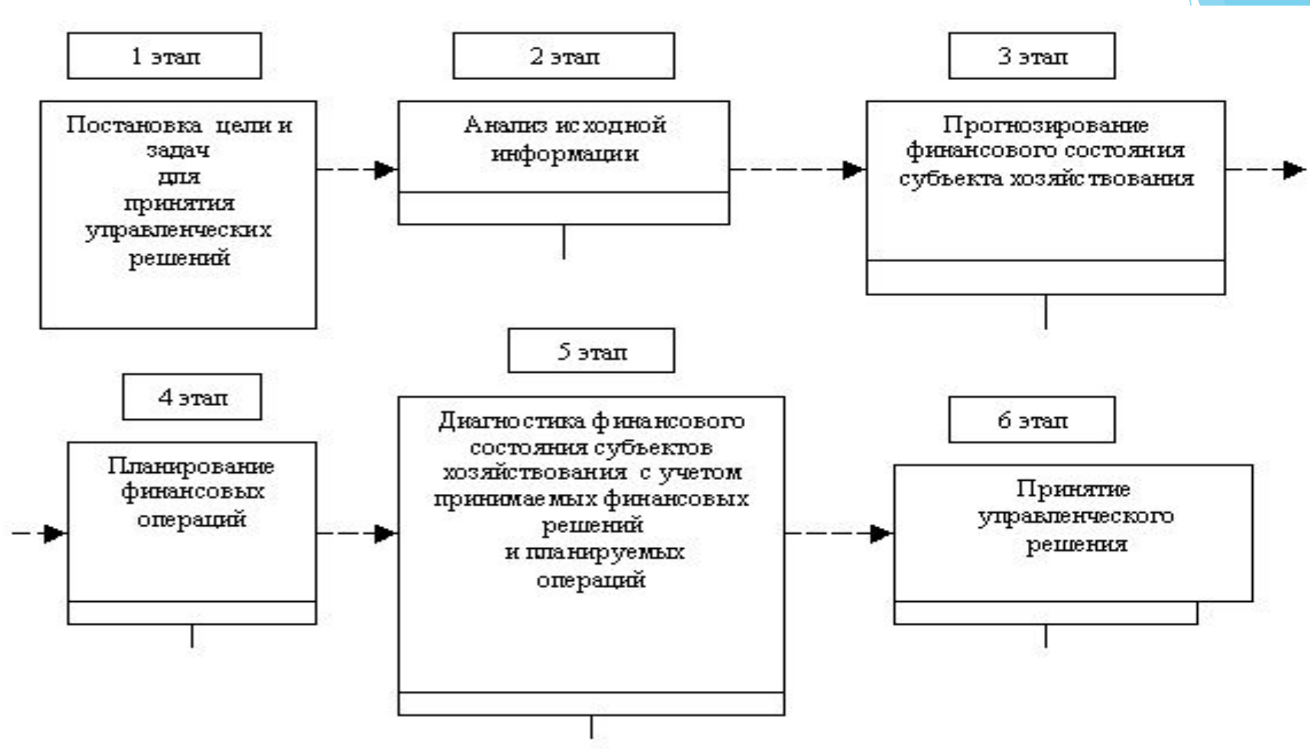
Рисунок 2 - Процесс принятия отдельных управленческих решений