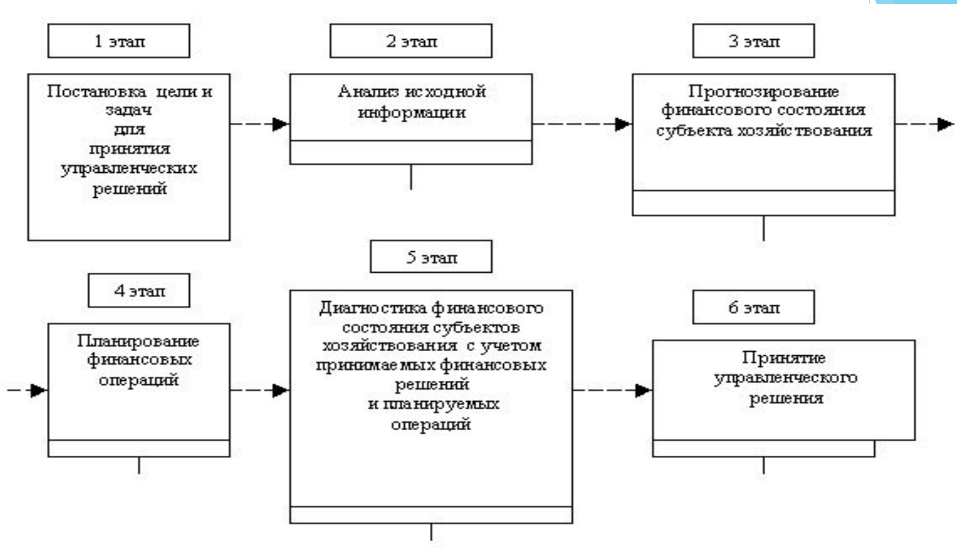
Рисунок 2 - Процесс принятия отдельных управленческих решений