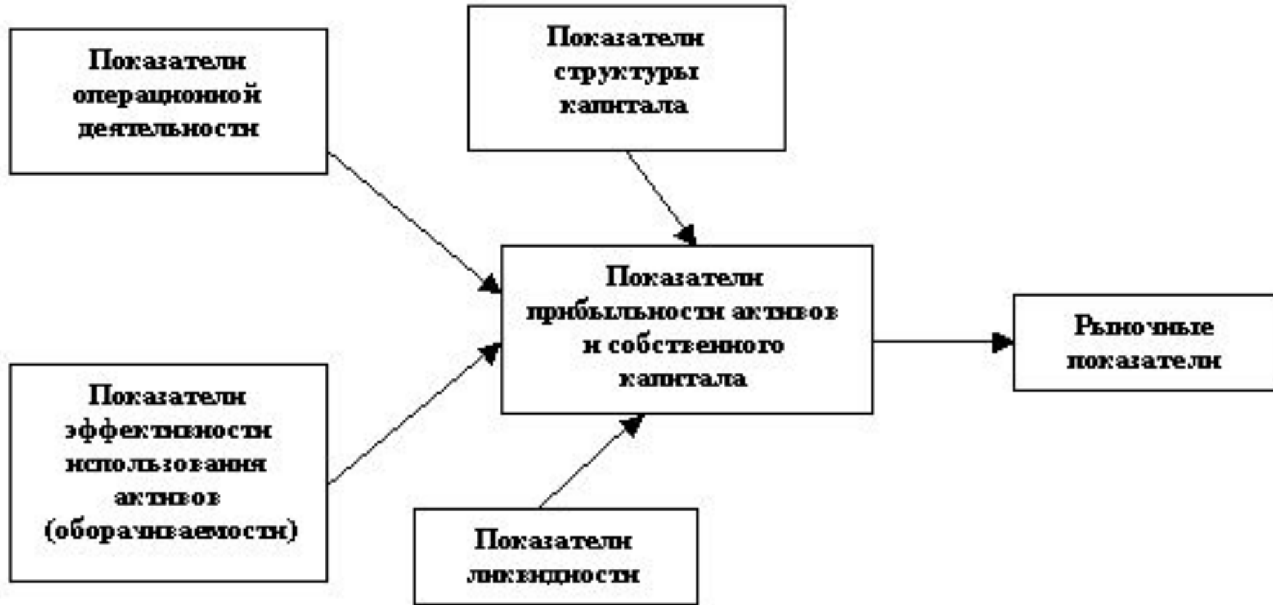
Рисунок 1 - Структура финансовых показателей предприятия