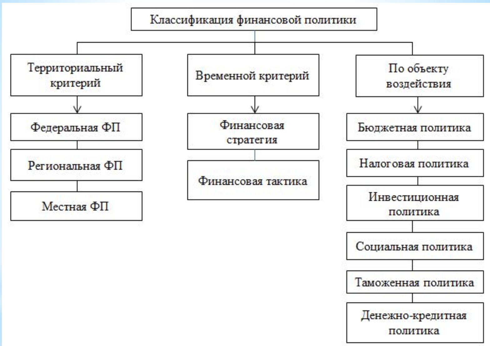
Направления (классификация) финансовой политики государства