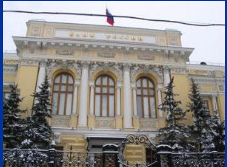
Банк России, Москва