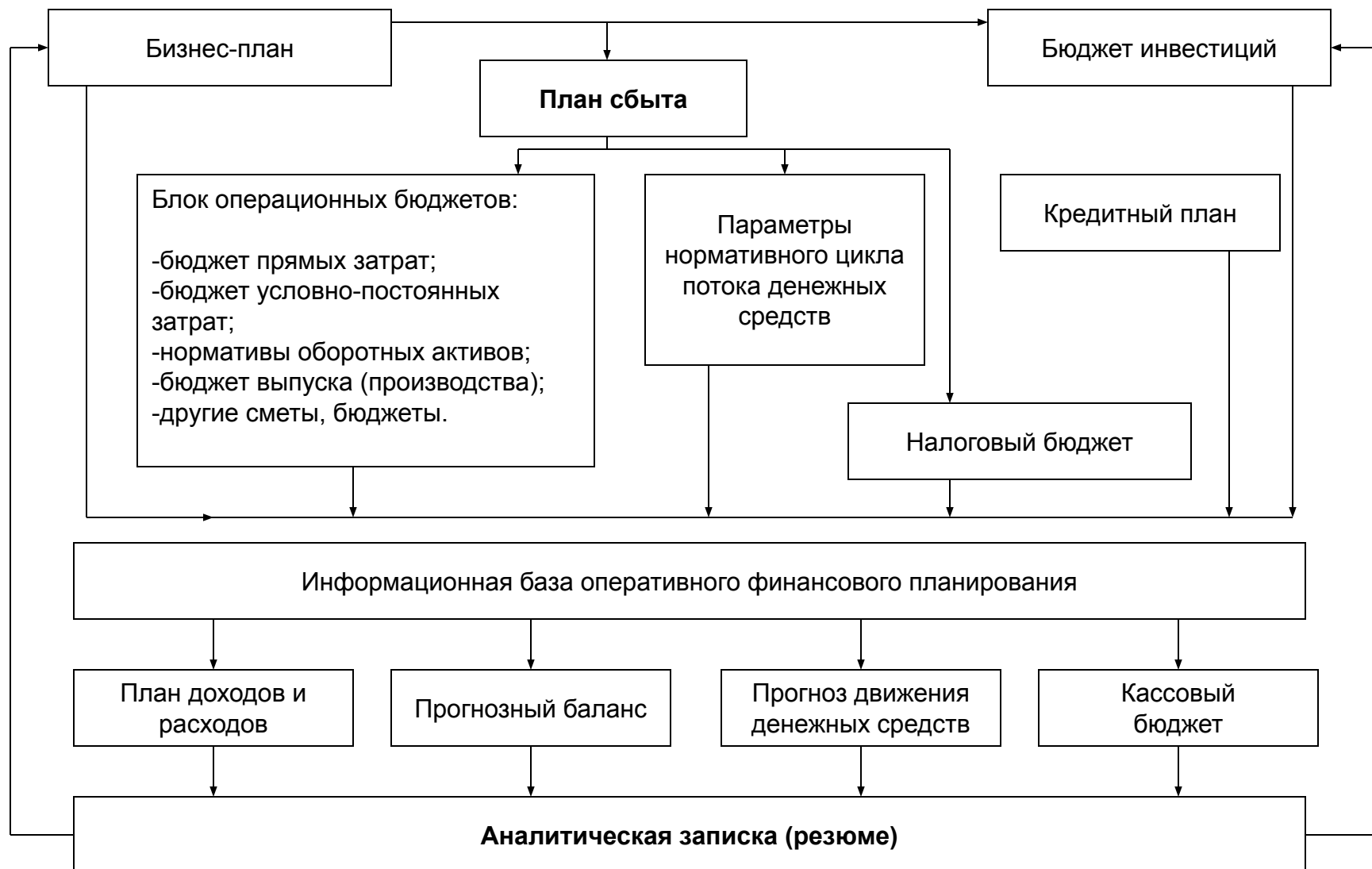
Схема 5.4. Структурная схема финансового планирования