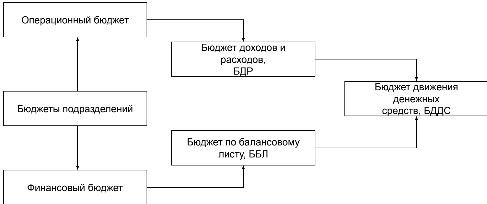
Схема 5.10. Структура генерального бюджета