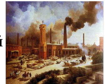
Fig. 1. Imagen de la Revolución Industrial en Alemania. (Revolución, /4).