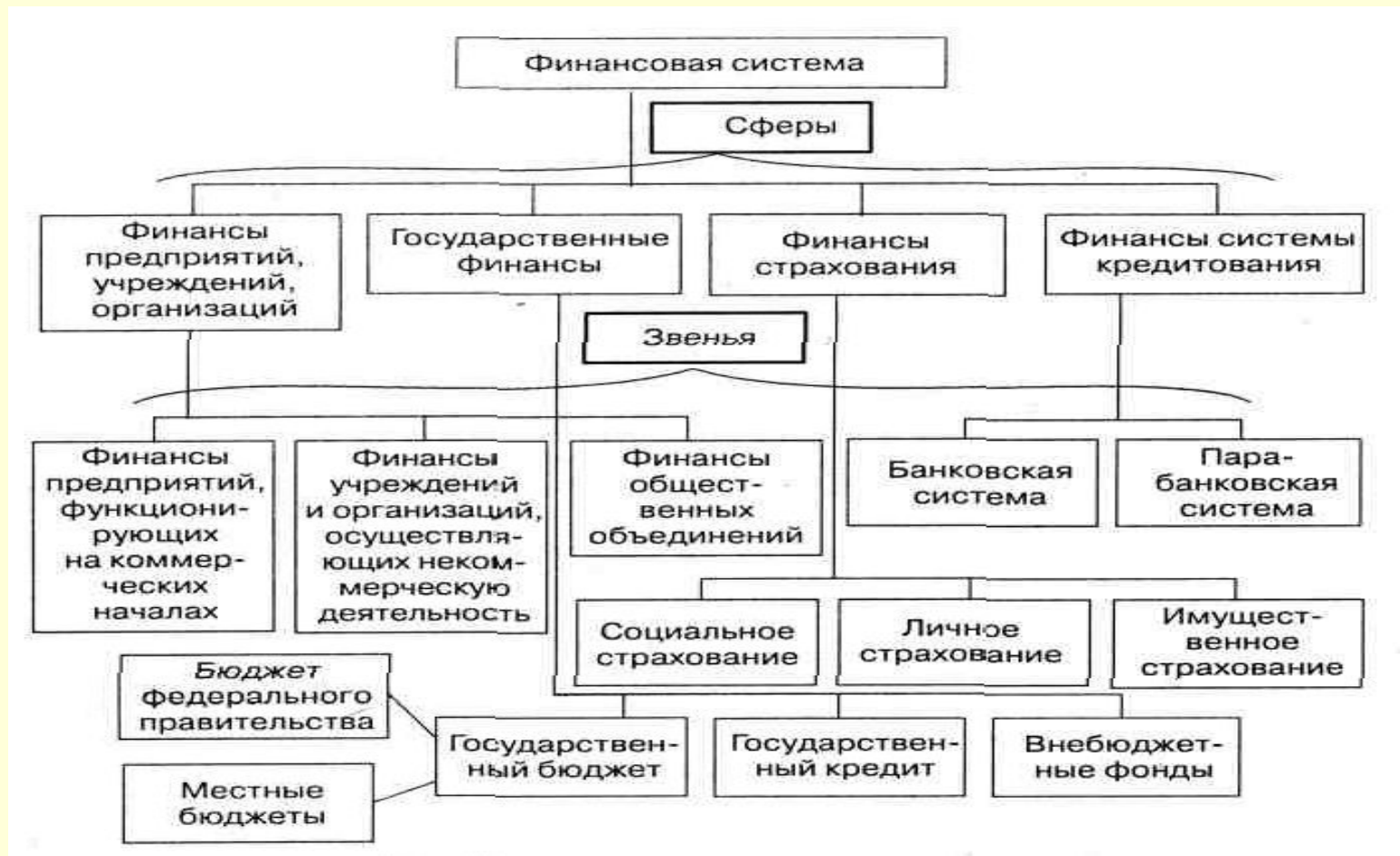
Схема финансовой системы