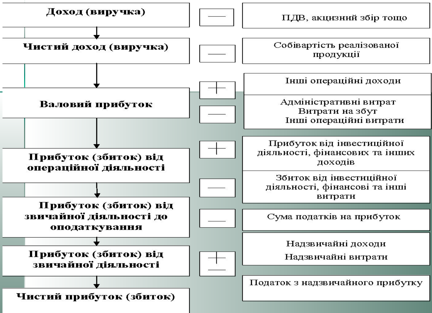
Рис. 8.1. Послідовність визначення чистого прибутку або збитку звітного періоду від реалізації продукції (товарів, робіт, послуг)