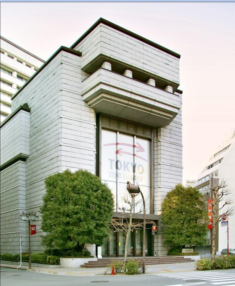
Токийская фондовая биржа