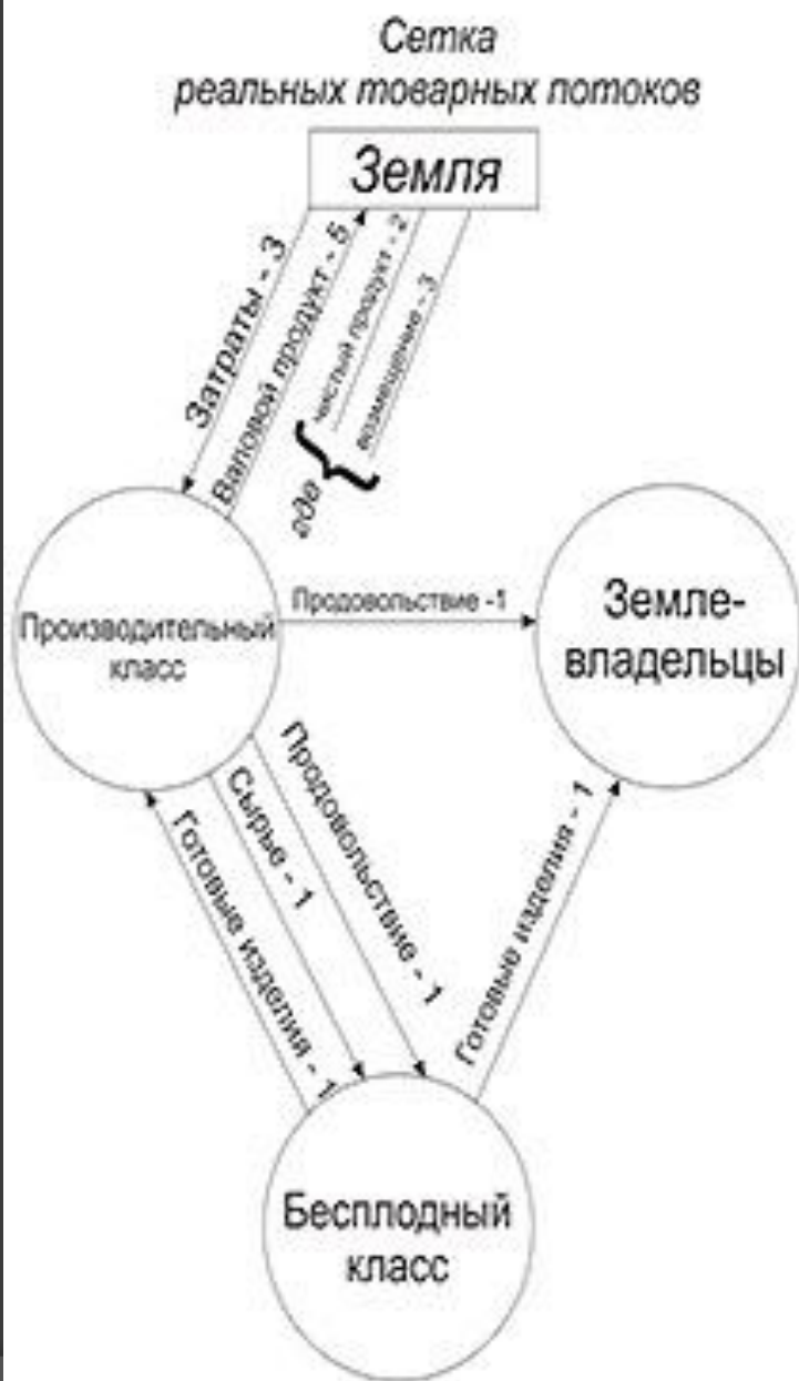
Схема товарного и денежного обращения в "Экономической таблице" Ф. Кенэ 1766 г.