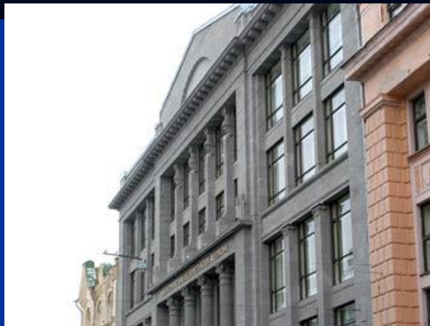
Министерство финансов России, Москва