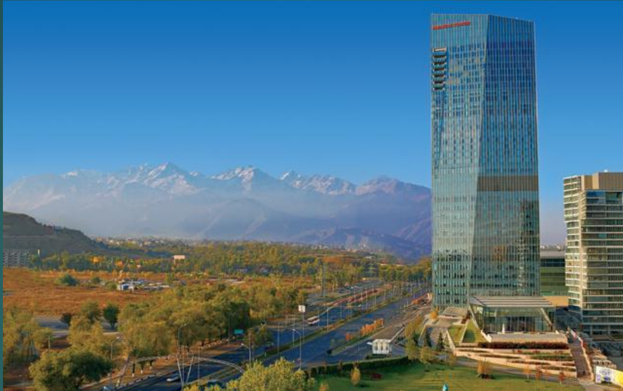
The Ritz-Carlton, Алматы