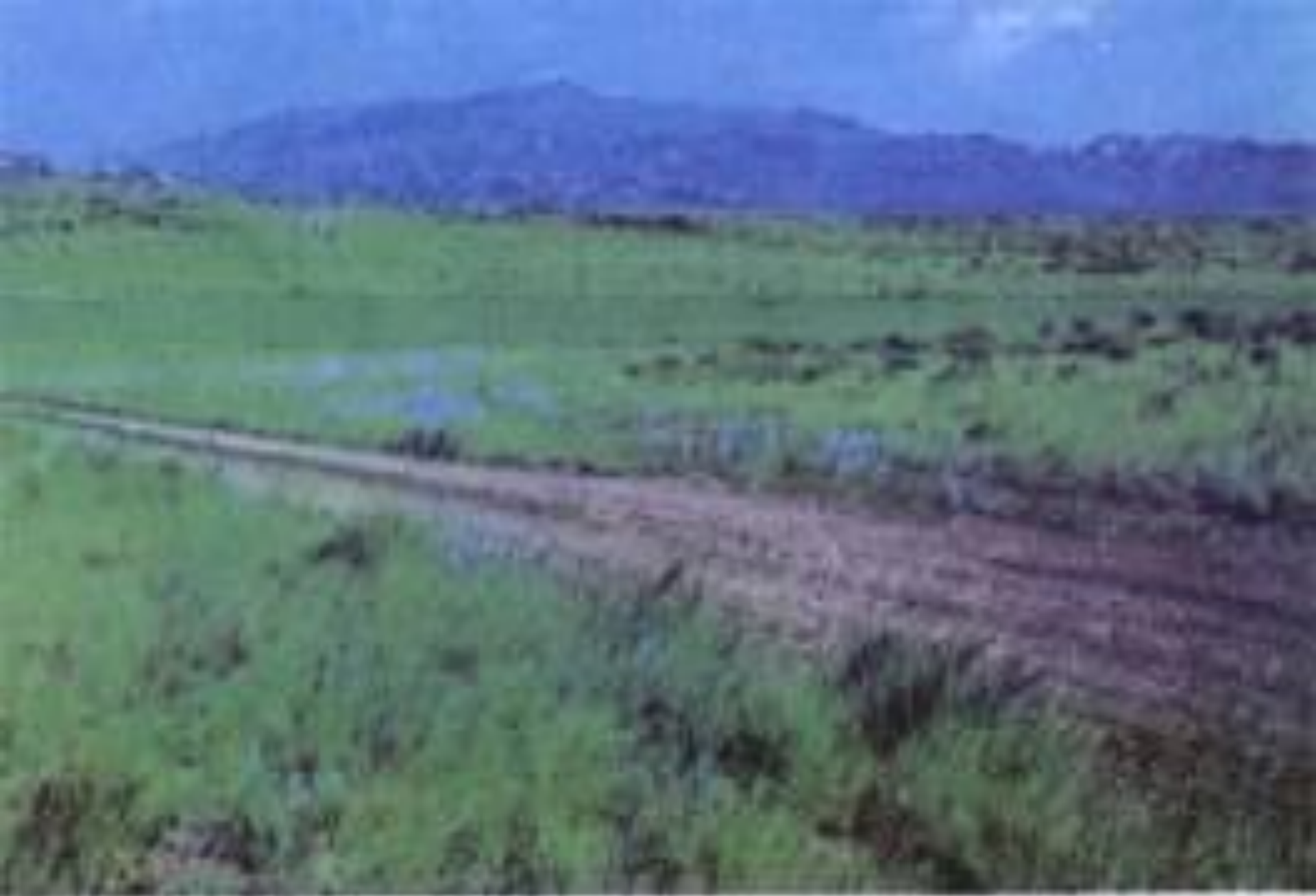
Сарыарса. Гөрө Уланнар.