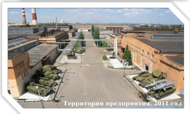
Территория предприятия. 2011 год