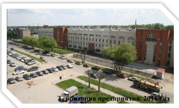
Территория предприятия. 2014 год