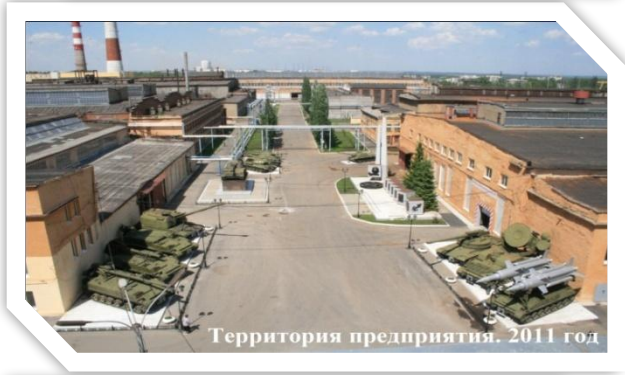
Территория предприятия. 2011 год