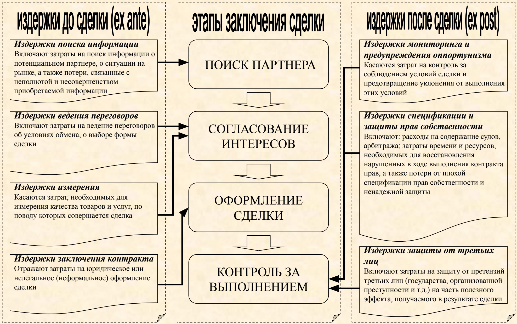
Рис. Классификация транзакционных издержек и этапы заключения сделки по Д.Норту и Т.Эггертссону в интерпретации О. Уильямсона, А.Н. Олейника, И.С. Пыжева