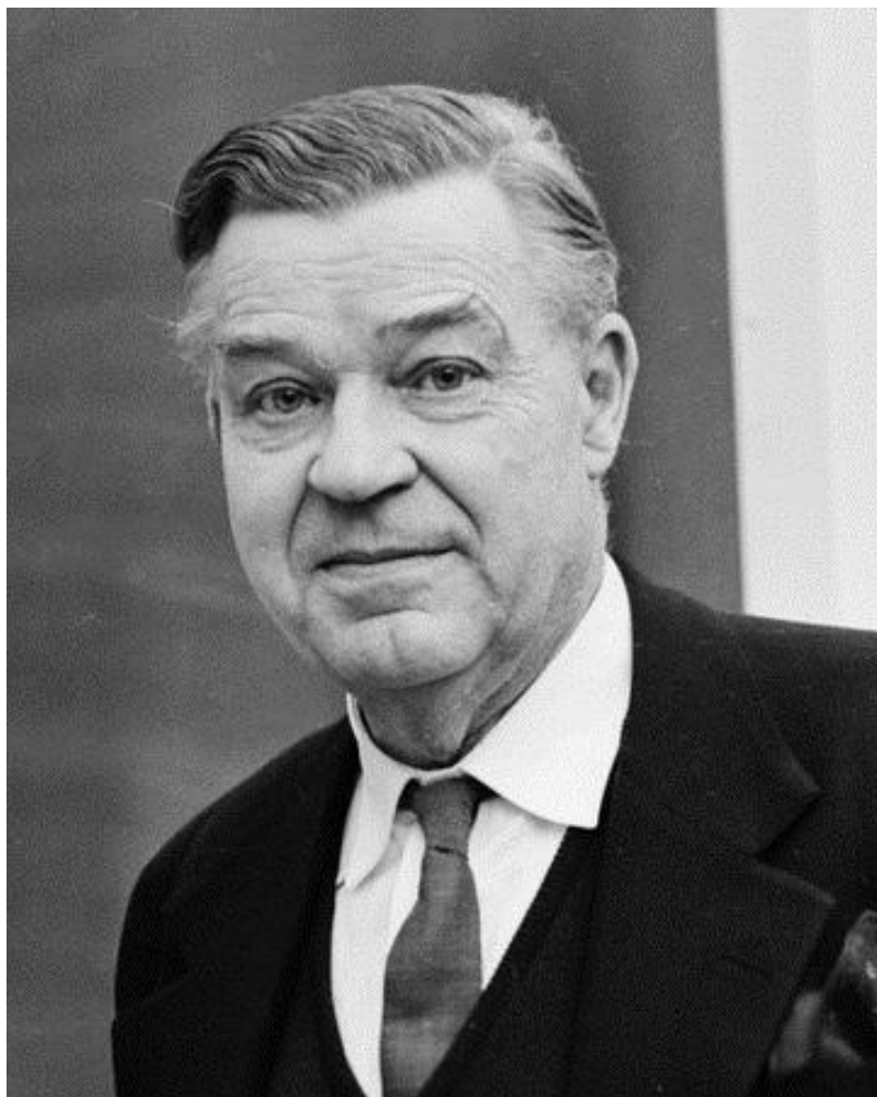
Гуннар Мюрдаль (1898 – 1987)

Нобелевская премия по экономике 1974 года «за основополагающие работы по теории денег и глубокий анализ взаимозависимости экономических, социальных и институциональных явлений»