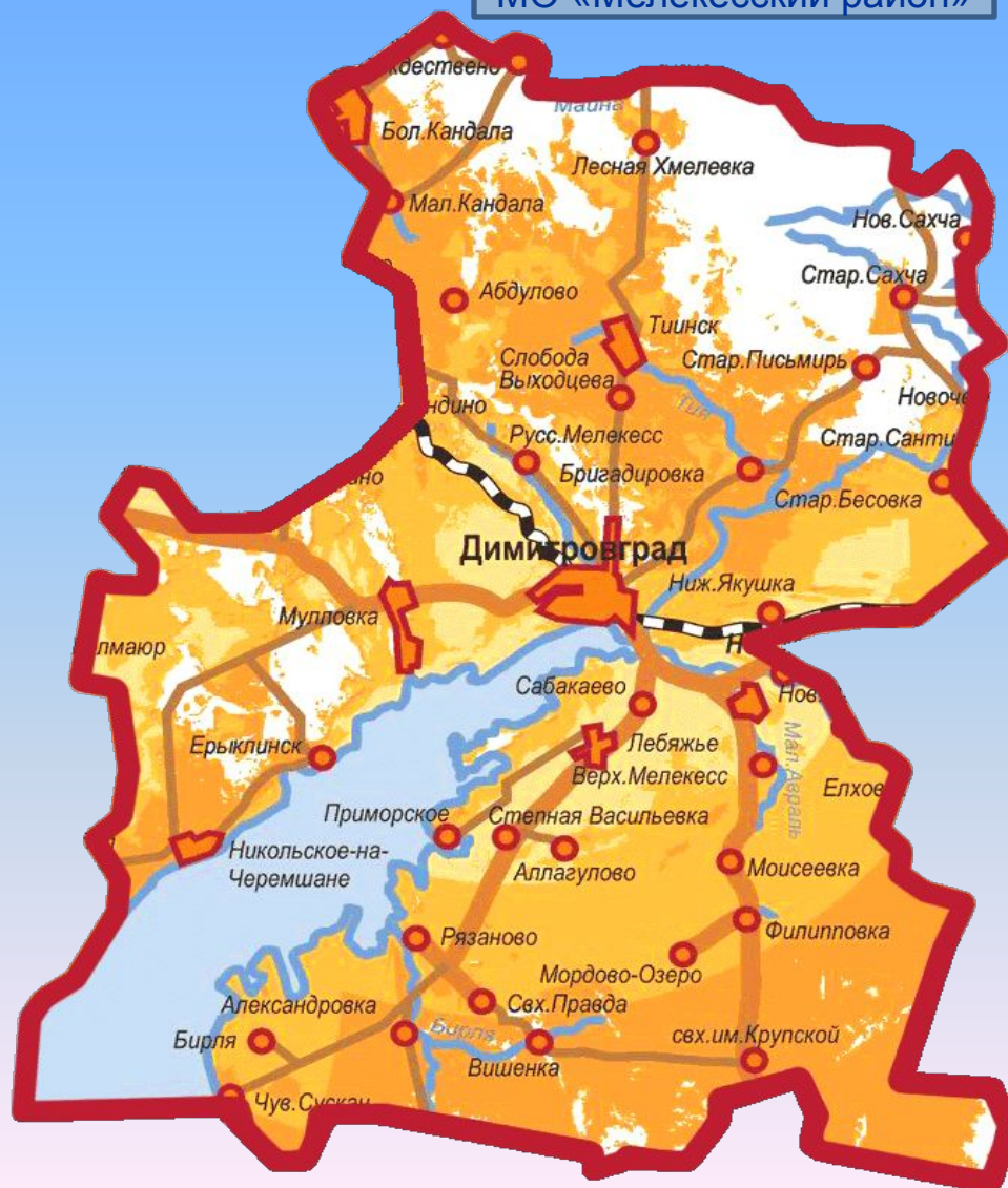
Карта МО «Мелекесский район»