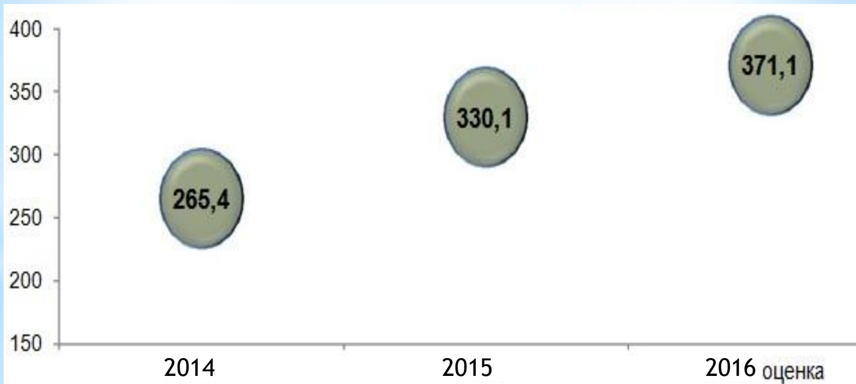
Диаграмма 2. Валовой региональный продукт на душу населения, тыс. рублей.