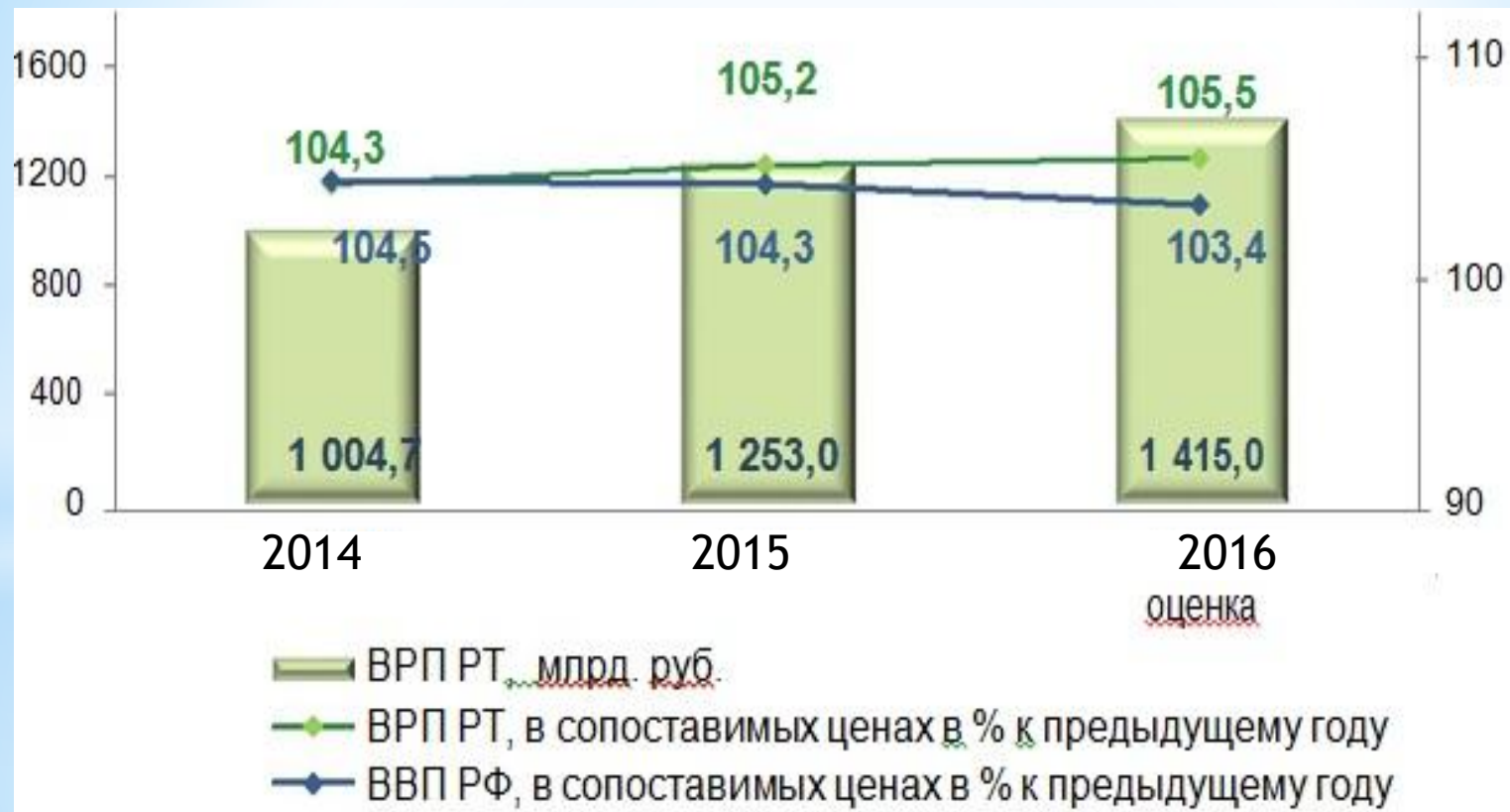
Диаграмма 1. Динамика ВРП Республики Татарстан и ВВП Российской Федерации.