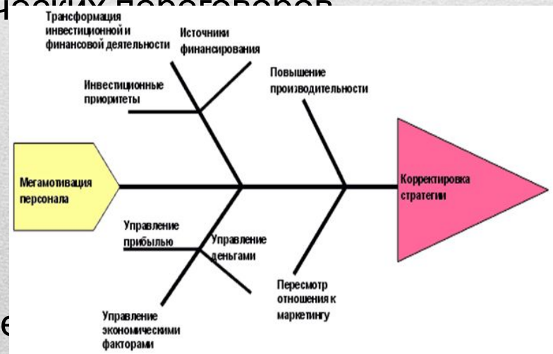
Таблица 4: Система антикризисных мер Исикавы.

(Нужно понизить дебиторскую задолженность с помощью установки новых цен, взятия нового кредита или услугой суда).