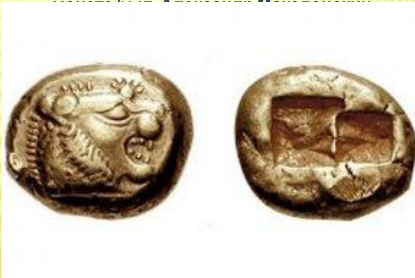
Лидийская монета, VI век до

Монеты из природного сплава золота и серебра впервые появляются в государстве Лидия в VII веке до н.э. Самая практичная форма монеты – круглая, хотя встречались самые разнообразные формы: квадратная, семиугольная, восьмигранник. Первым кто изобразил свой профиль на