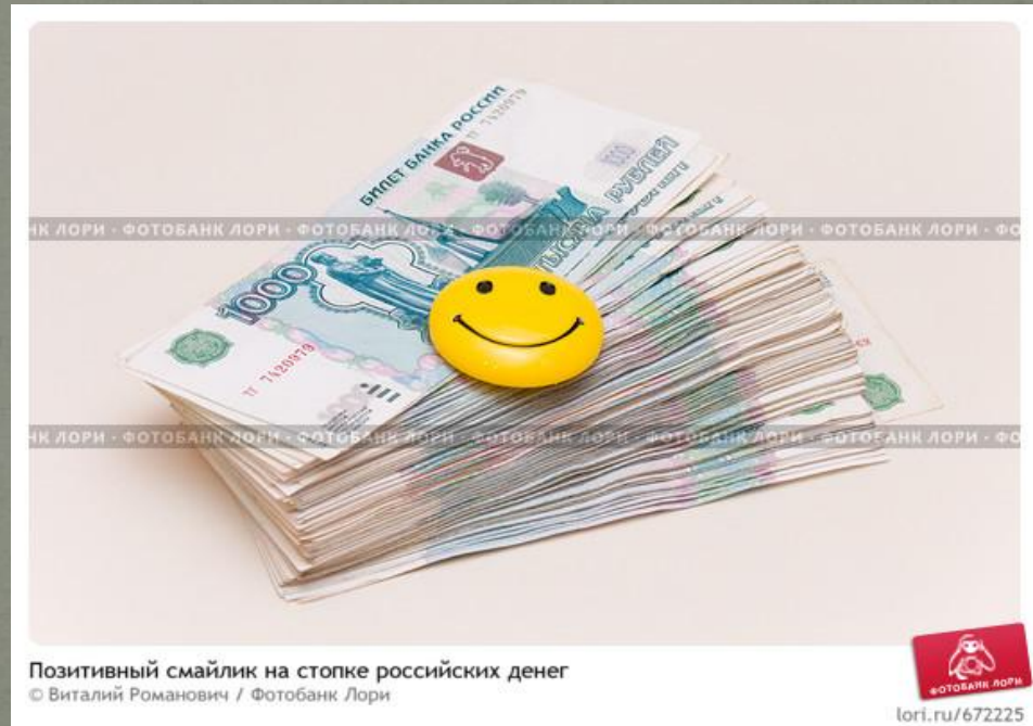
Позитивный смайлик на стопке российских денег