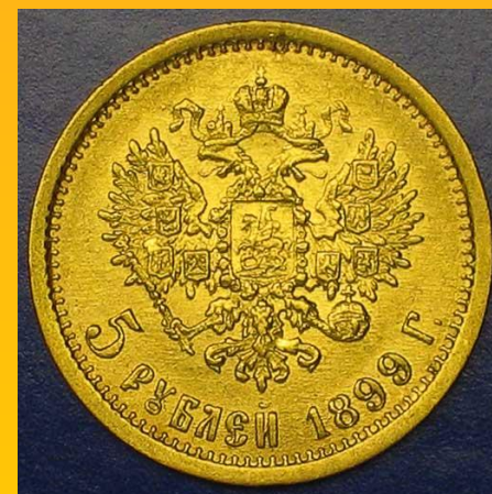
Золотые 5 рублей 1899 г. реверс