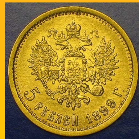
Золотые 5 рублей 1899 г. реверс