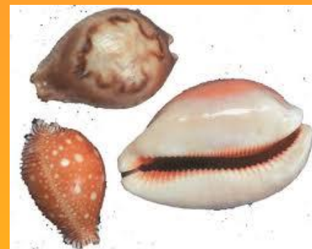
Раковины Каури (Приморье)