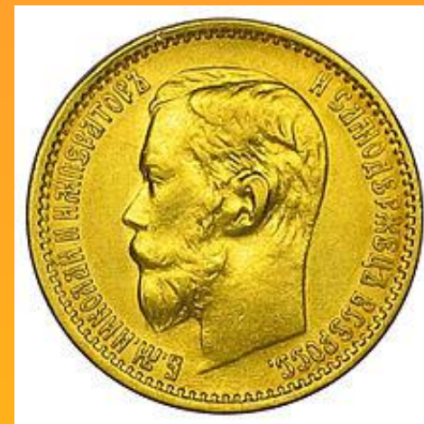
Золотые 5 рублей 1899 г. аверс