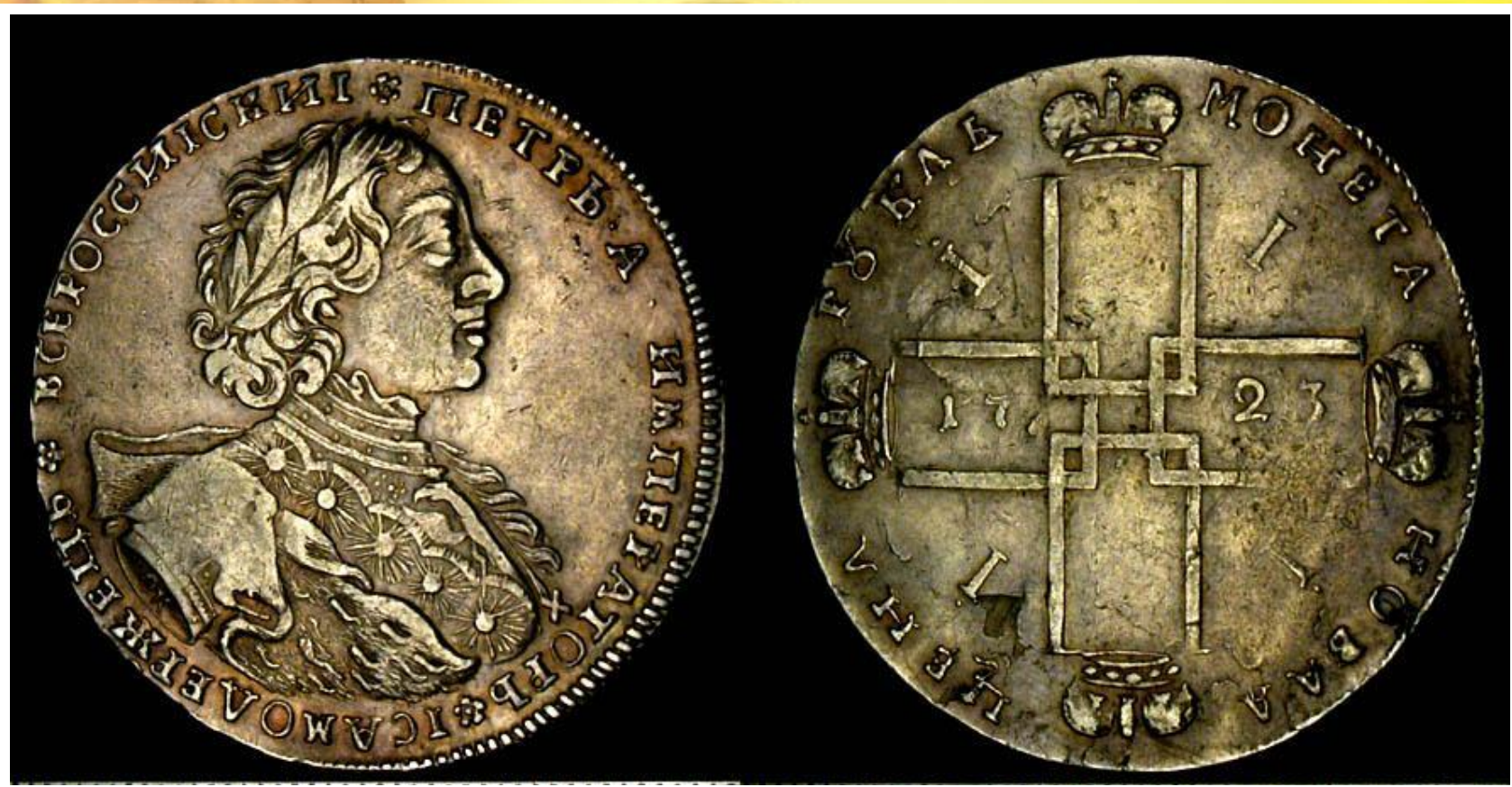
Рубль Петра I