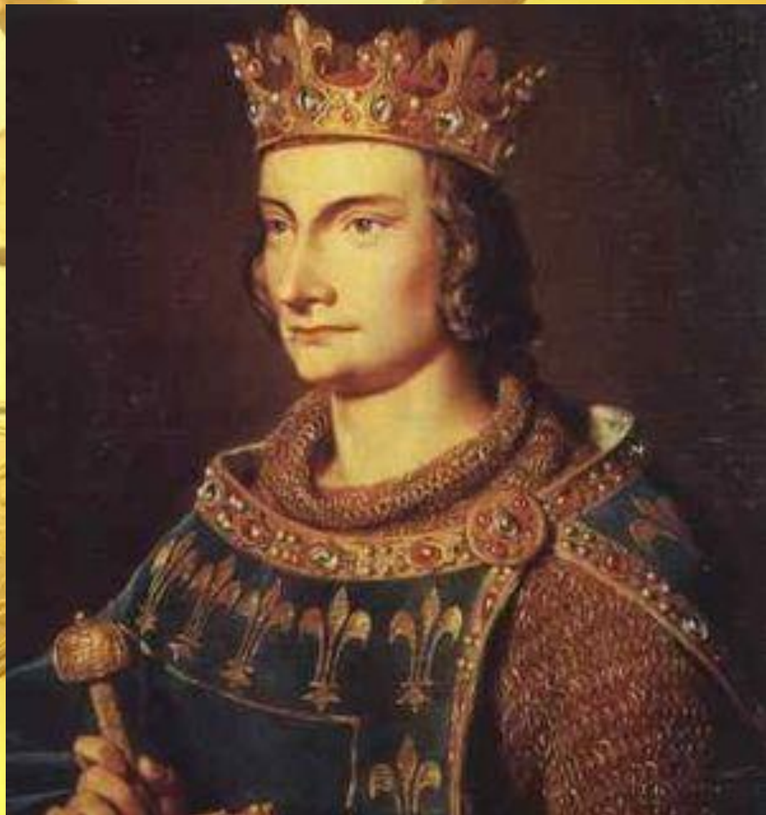
Филипп IV Красивый