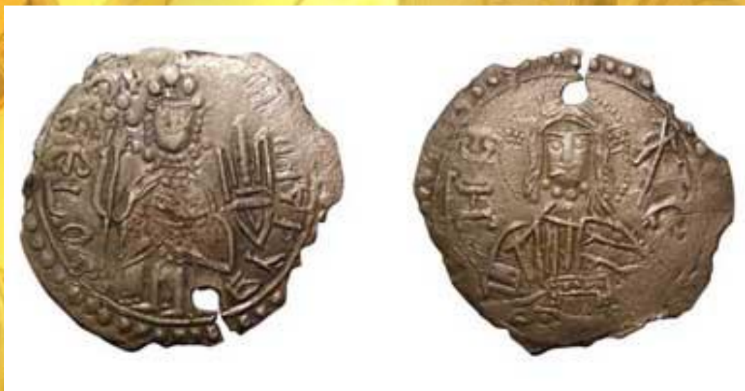
Монета Киевской Руси