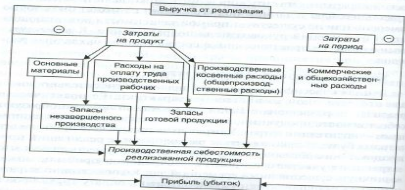
Рис. 9.2. Сравнение затрат на продукт и затрат на период