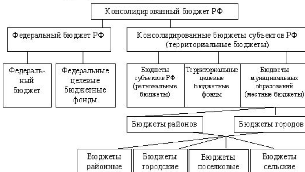
Структура консолидированного бюджета в РФ