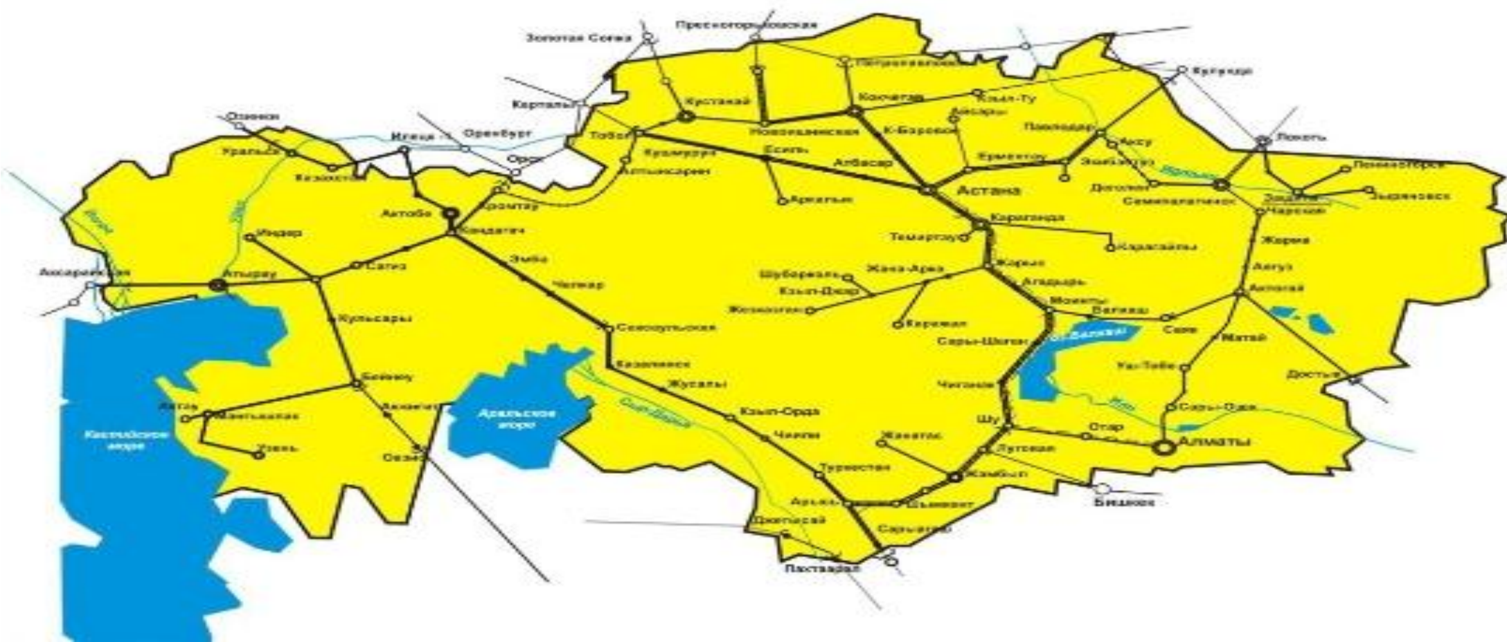
СХЕМА СЕТИ ЖЕЛЕЗНОЙ ДОРОГИ

За годы реализации ГПФИИР сняты инфраструктурные ограничения. Полностью решен вопрос энергодефицита, построены жд.«Западная Европа – Западный Китай», 2 транзитных коридора Центр-Юг и Центр-Восток), Узень–государственная граница с Туркменистаном, Жетыген–Коргас, Бейнеу-Жезказган, Аркалык-Шубаркуль).