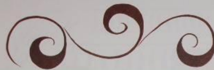
ВЕДУЩИЙ СТЕБЕЛЬ — «КРИУЛЬ»