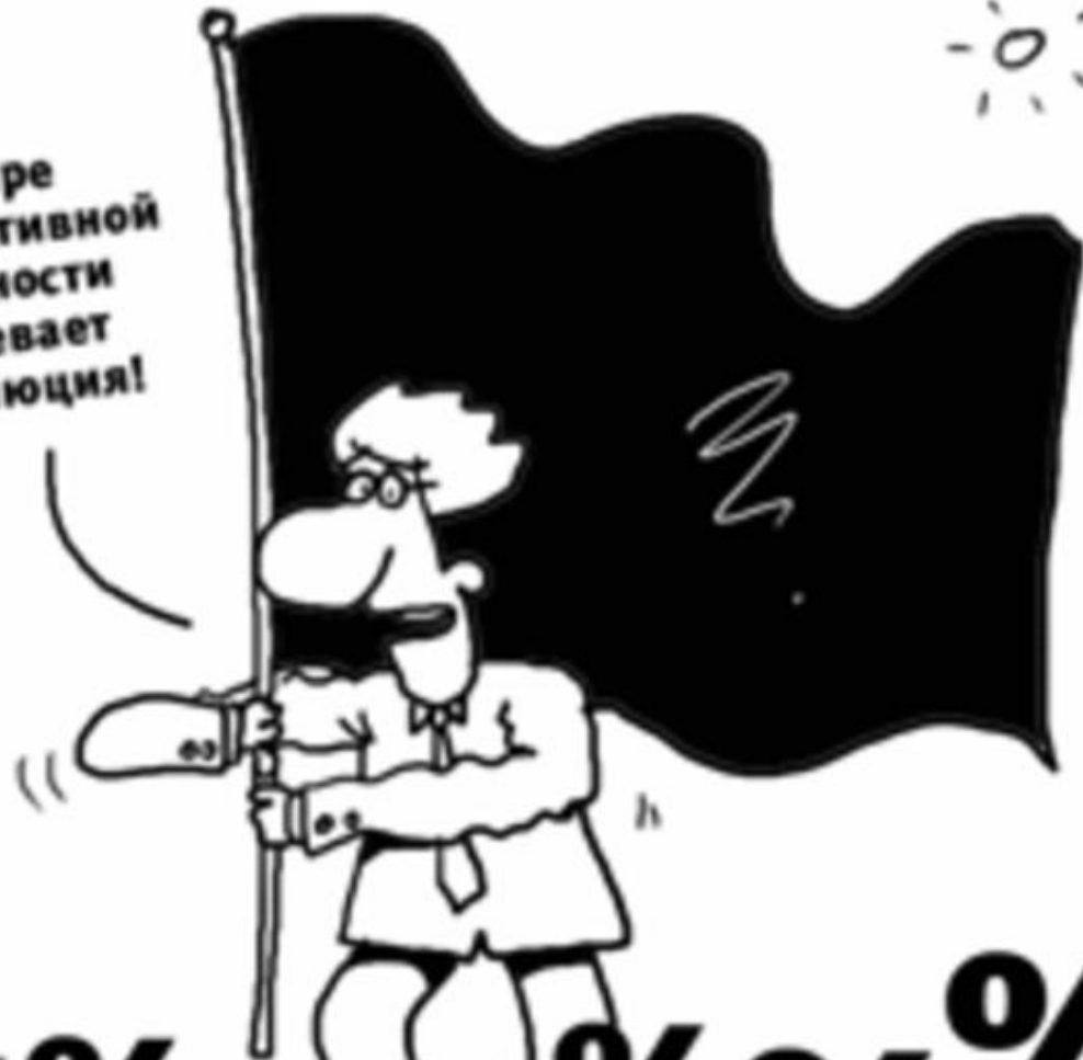
рис. А. Полукина

В мире корпоративной отчетности назревает революция!