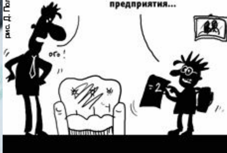
рис. Д. Полукина