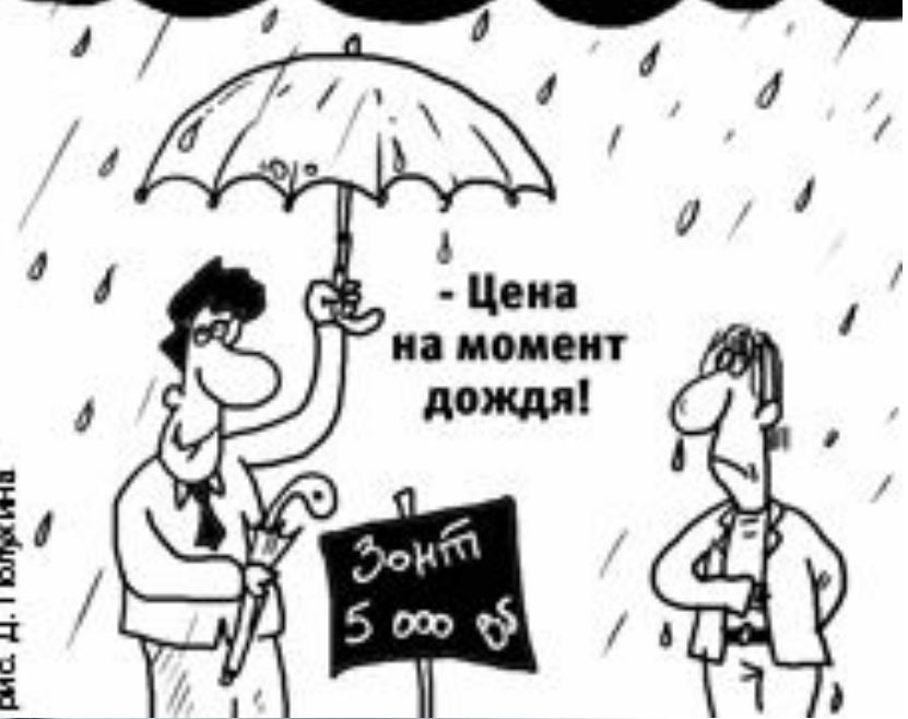
рис. Д. Полукина